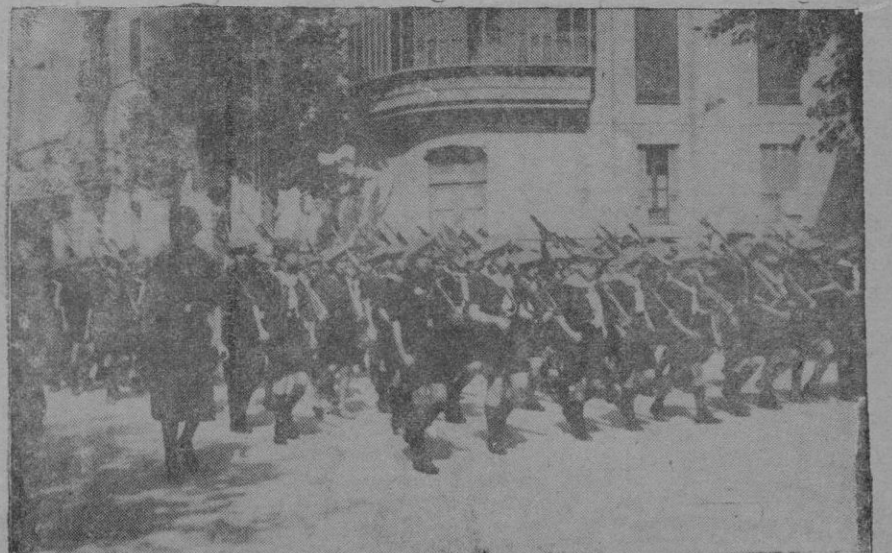
Otro aspecto del desfile