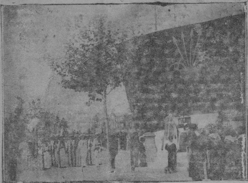
La misa de campaña en el "Día del Flecha"

El fuerte temporal de lluvia reinante ha impedido toda actividad en el día de hoy, habiéndose presentado en nuestras líneas 20 milicianos.