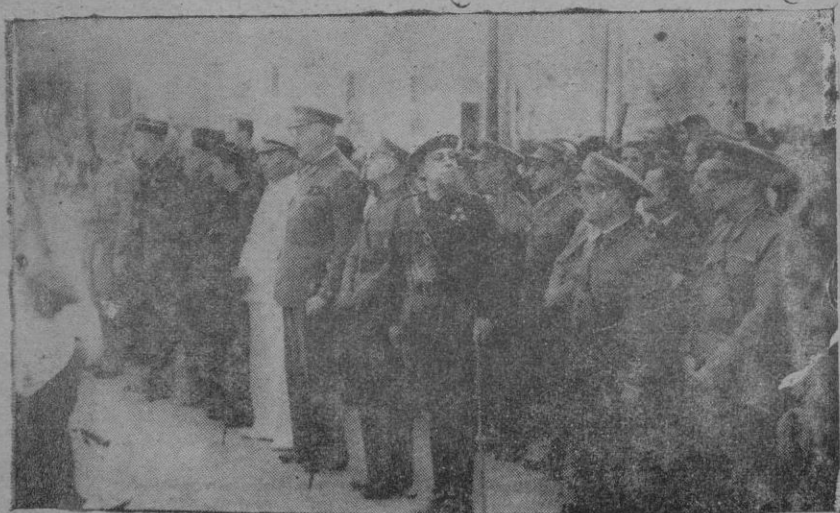
La presidencia en el desfile de los Flechas