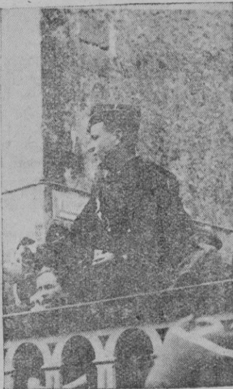
El Gobernador Sr. Torres, en el momento de su discurso, en Campos, a la concentración falangista celebrada anteayer