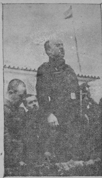
El Jefe de Falange en el momento de dirigir la palabra a los concentrados, después de la misa de campaña

neral Goded, siendo contestado por todos: ¡Presente!