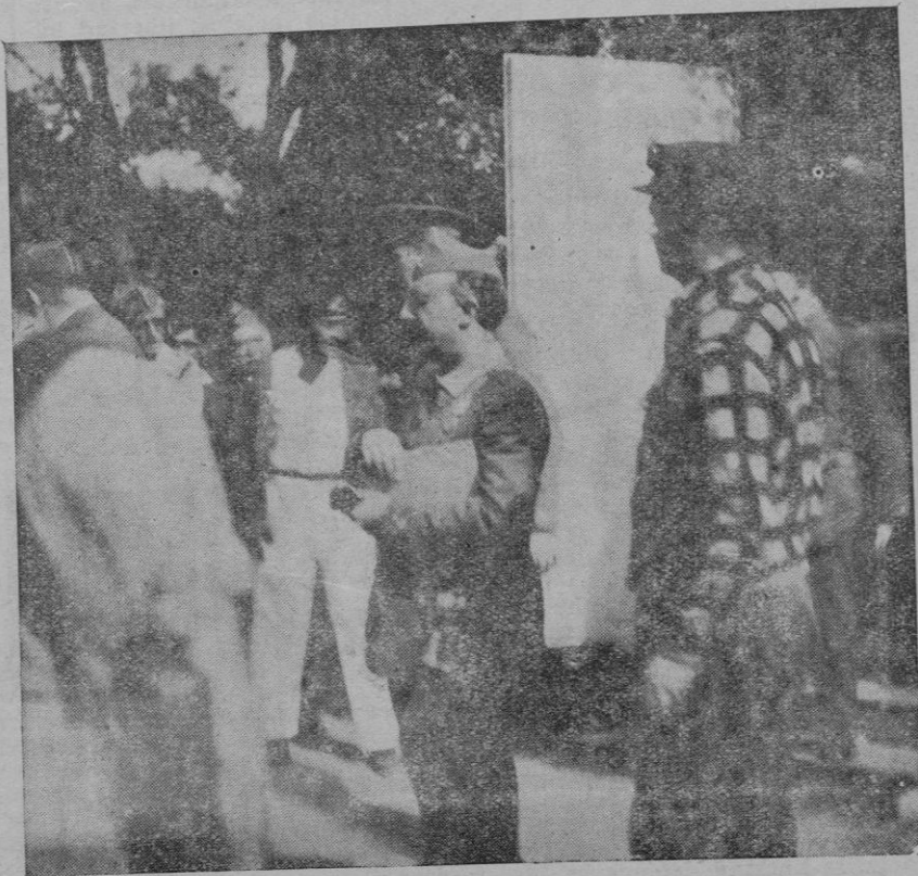
Reciente fotografía del Generalísimo Franco, paseando por las calles de Salamanca

Y para llevarla a cabo, nosotros tenemos el honor de jurar dos garantías, ante Dios y nuestro pueblo. La primera, que mantendremos el espíritu y el estilo que la hora del mundo nos pide, que el genio de nuestra Patria nos ofrece, luchando lealmente