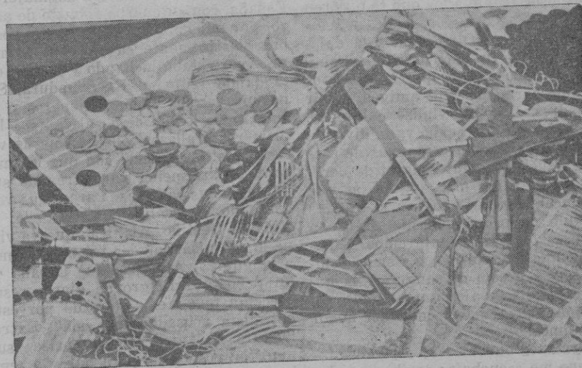
Así como a los dirigentes de la expedición contra Mallorca no les guiaba otro provecho que el de su renombre personal, así a los dirigidos les interesaba tan sólo la codicia del saqueo. Su botín de guerra eran relojes, dinero, cubiertos de plata y hasta títulos de la Deuda Amortizable. No tuvieron el valor del soldado para arrebatarles las armas al enemigo, ni la austeridad del comunista para resistir a las tentaciones del dinero