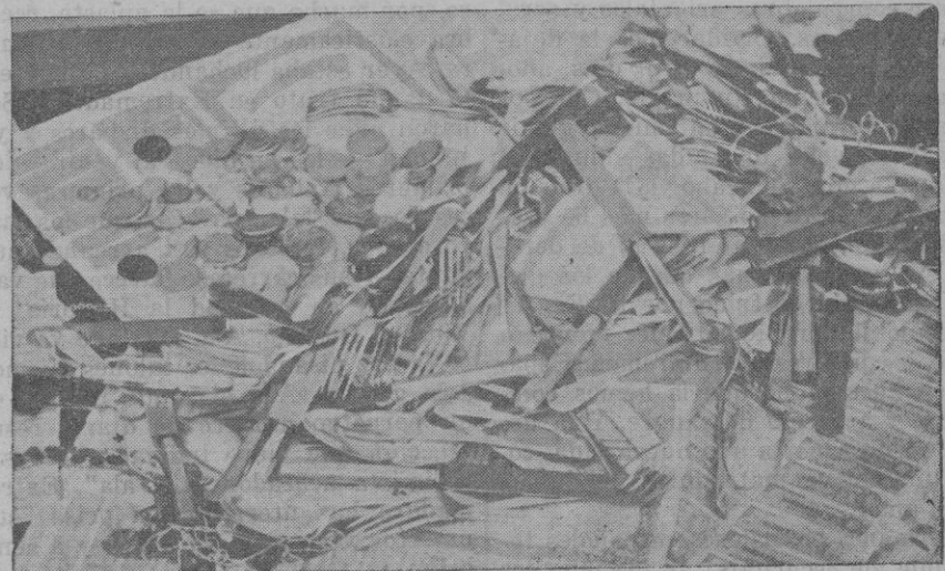
Así como a los dirigentes de la expedición contra Mallorca no les guiaba otro provecho que el de su renombre personal, así a los dirigidos les interesaba tan sólo la codicia del saqueo. Su botín de guerra eran relojes, dinero, cubiertos de plata y hasta títulos de la Deuda Amortizable. No tuvieron el valor del soldado para arrebatarles las armas al enemigo, ni la austeridad del comunista para resistir a las tentaciones del dinero