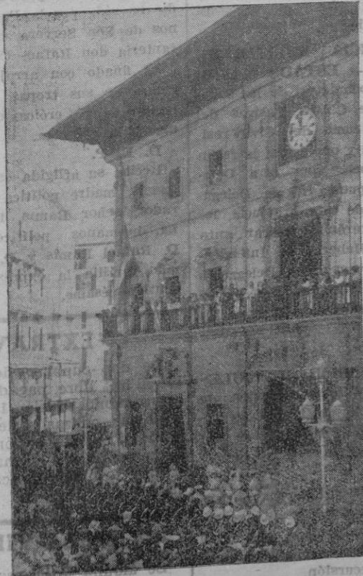
Momento de ser izada en la Casa Consistorial de Palma, la bandera bicolor