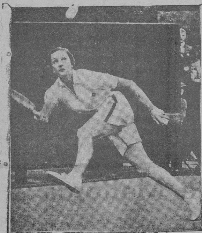
La tenista yanqui Miss Helen Jacobs, que, en su encuentro con la danesa Sperling salió vencedora, ganando el título de campeona