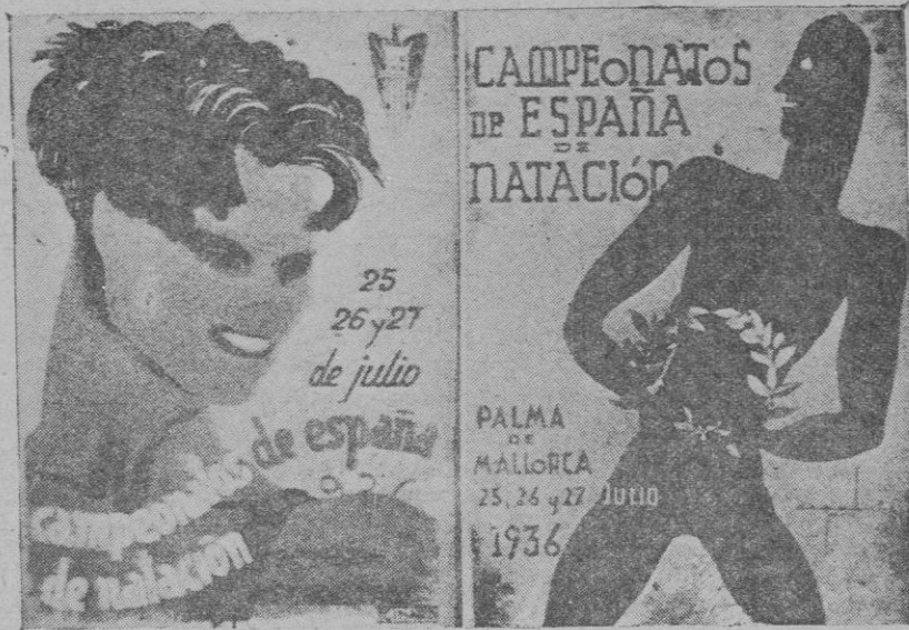
Los carteles premiados en primero y segundo lugar para la propaganda de los campeonatos nacionales de natación, que tendrán lugar en Palma de Mallorca

Con la benevolencia del Sr. Director de LA ALMUDAINA, en breve publicaré mi tercer y último artículo (si tal nombre merecen los dos publicados) el cual brindaré al Comité Regional de Baleares de la U. V. E.,