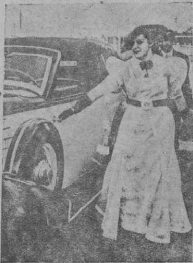
Barcelona. — Se celebró un interesante concurso de elegancia automovilística. — He aquí el primer premio de conjunto

"Marcial Lalanda no torea. No puede. El diestro de Vaciamadrid sufre una luxación en el pie derecho, y aunque confiaba él en que para el día de la gran corrida de la Prensa podría estar en condiciones de trabajar, es lo cierto, por desgracia, que Marcial no