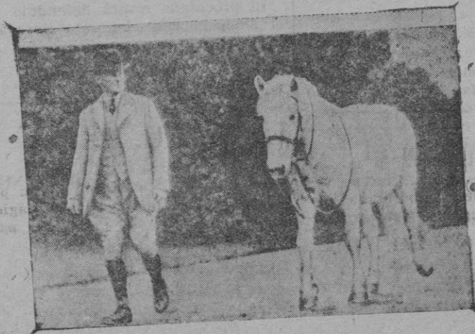
El caballo del rey Jorge de Inglaterra. — "Jock". este caballo vive en Windsor y tiene un servidor que le saca todos los días a pasear