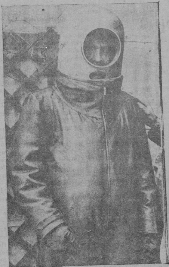
El ilustre aviador teniente coronel don Emilio Herrera, con el traje y escafandra que ha probado, con completo éxito, ante el Comité de Ascensión, en el aeródromo de Cuatro Vientos, y que utilizará en su vuelo estratosférico