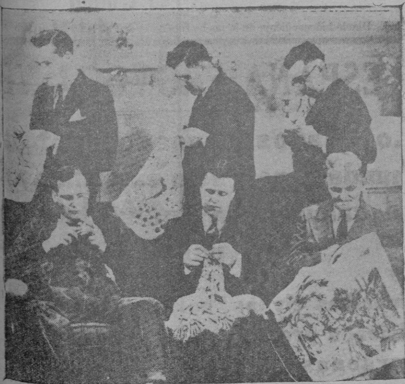
En Chicago se ha celebrado un concurso de bordados en seda y tricot. Ha tenido un gran éxito. He aquí algunos de sus concursantes