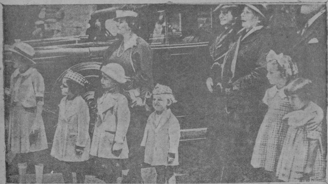
En ocasión de la salida del Vaticano, para la inauguración del Palacio de las Sagradas Congregaciones, de Su Santidad Pío XI, sus familiares se detuvieron para presenciar su paso por las calles de Roma. — En la fotografía aparecen su hermana y sus sobrinas

Se ha dicho que una destacada personalidad socialista, de las que se mantienen a la expectativa, había manifestado que el mencionado documento pecaba de falta de habilidad en su redacción. En efecto, ha sido inhábil, si es que existe ese propósito —que a lo mejor, no existe— de atraer se la opinión independiente. Para los