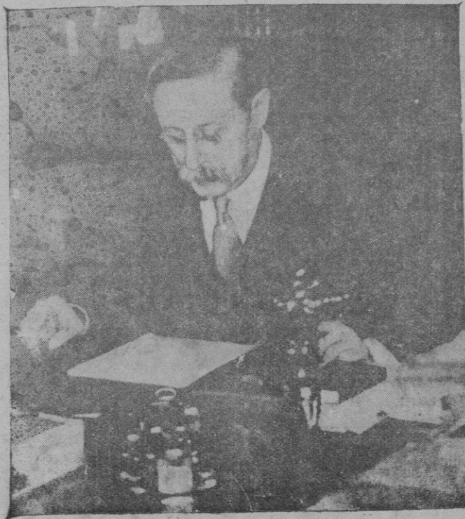
Paris. — M. León Blum, jefe del Partido Socialista francés, señalado como jefe del futuro Gobierno