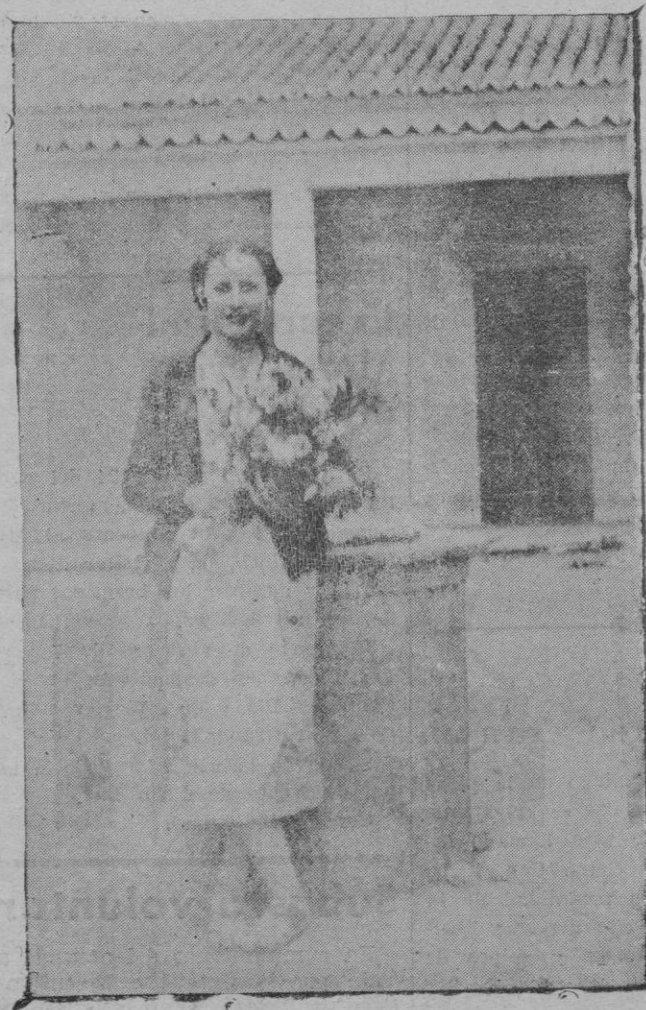
Srita. que resultó elegida "Madrina de la Excursión"