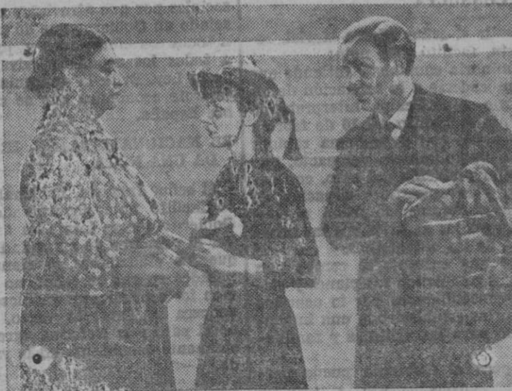
UN MOMENTO DE LA PELICULA "ANITA LA PELIRROJA", DE LA MARCA RADIO FILMS, QUE HOY ESTRENA "PROTECTORA CINEMA" Y EN LA QUE HACE SU PRESENTACION AL PUBLICO EL NUEVO LUMINAR DE 16 AÑOS ANNE SHIRLEY, EN LA QUE CIFRAN SUS ESPERANZAS LOS MAGNATES DE HOLLYWOOD