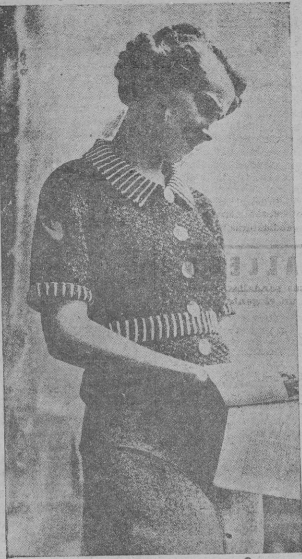
Jersey, en rojo y blanco, con botones de este último color. Falde de lana gris