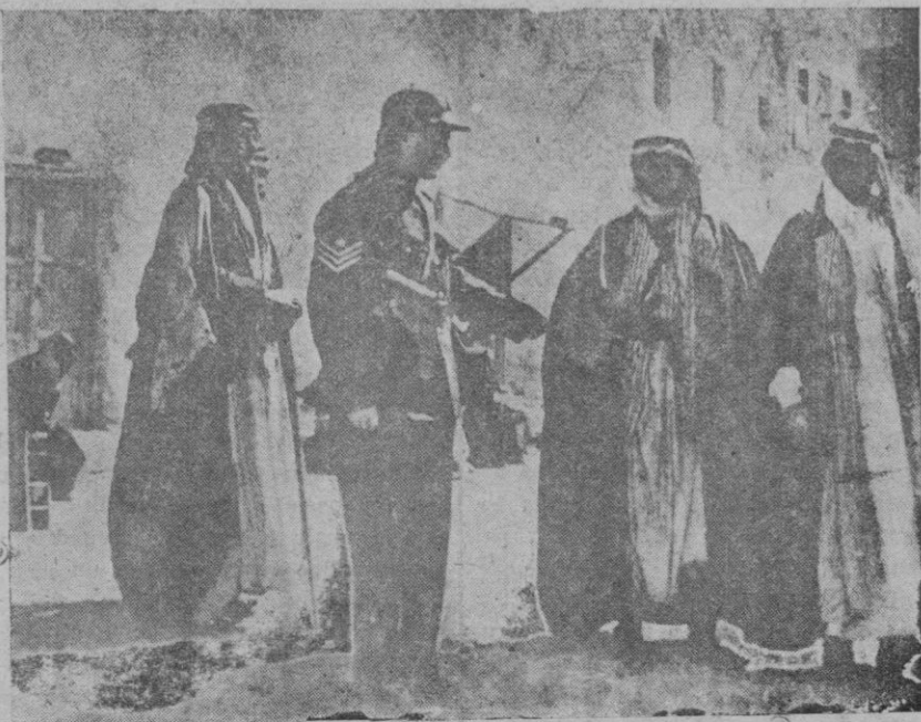
Los sucesos de Palestina. — Un oficial de la policía británica en Jaffa, con algunos jefes árabes