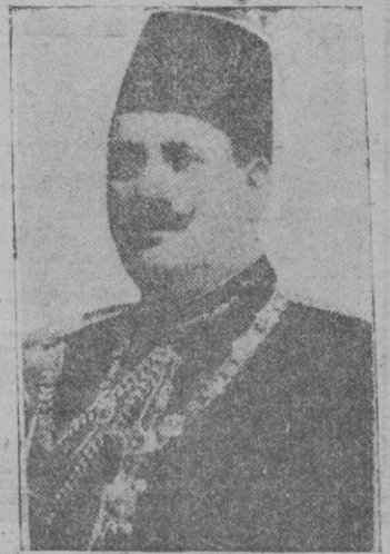
El rey Fuad, de Egipto, que se halla muy grava