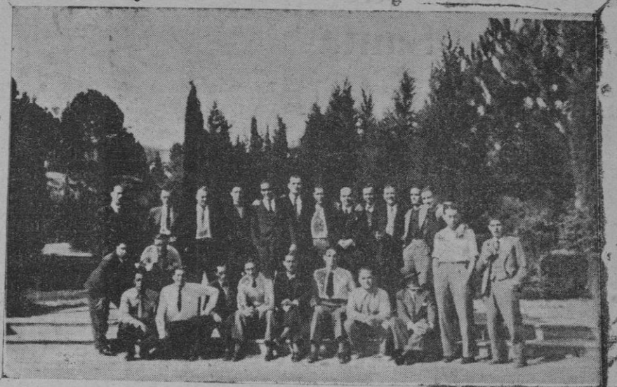
Del encuentro Sabadell-Mallorca.—Los jugadores y acompañantes del C. D. Mallorca frente al Hotel de Bella Terra antes de empezar el partido

"Illa d'Or": Ramirez I, Bassa, Leonard (10), Ramirez II (2) y Cabelleros (2).