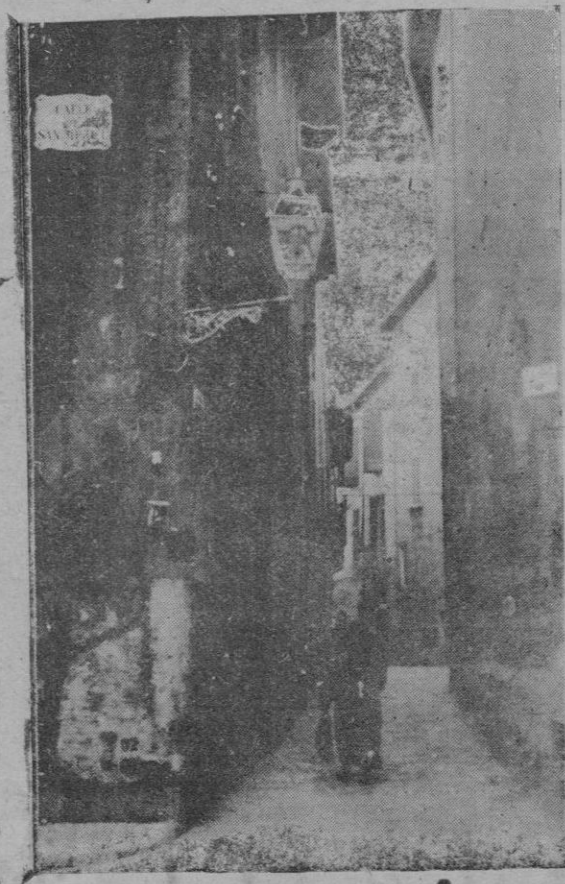
Otra de las calles que desaparecen con motivo de la construcción del mercado del Olivar

perficie de uno o más buques en el fondo del mar, han de dejar libre de agua el espacio de los mismos, por medio de la absorción, dejando así maniobrar perfectamente al objeto que se persigue.