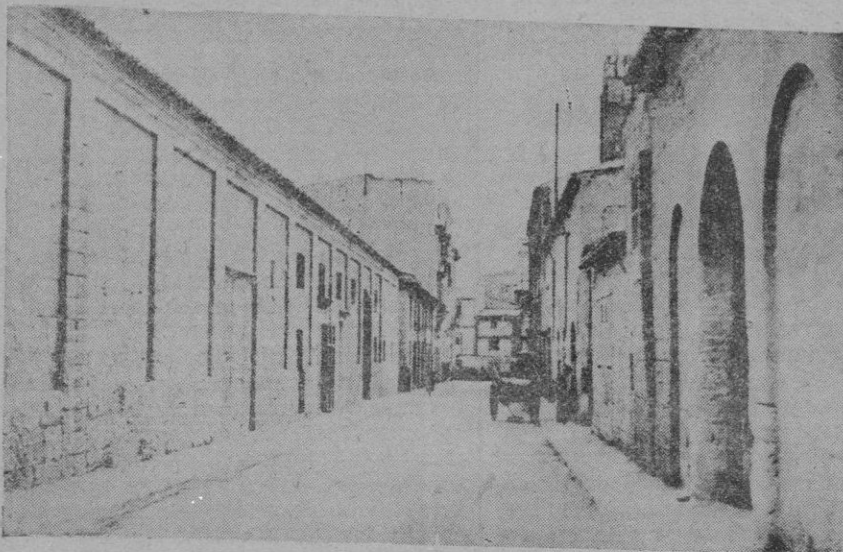
El mercado del Olivar. — Una de las calles que desaparecen, con motivo de los derribos para asentar el nuevo mercado

Pero ahora, parece que la cosa va en serio. En ingeniero militar español don Manuel Moxó, se ha dedicado durante dos años al estudio científico de la cuestión, a base de unos aparatos que, cubriendo la su-