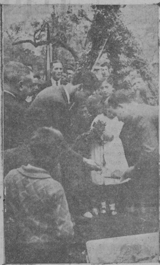
El Alcalde de Buñola colocando la primera paleta para el edificio escuela "Baix del Puig"

Diabetes, Gangrenas, Ulceras varicosas Reumatismo crónico Participa a sus clientes y amigos haber trasladado su consultorio a la calle de Pelaires, núms. 60 y 62.