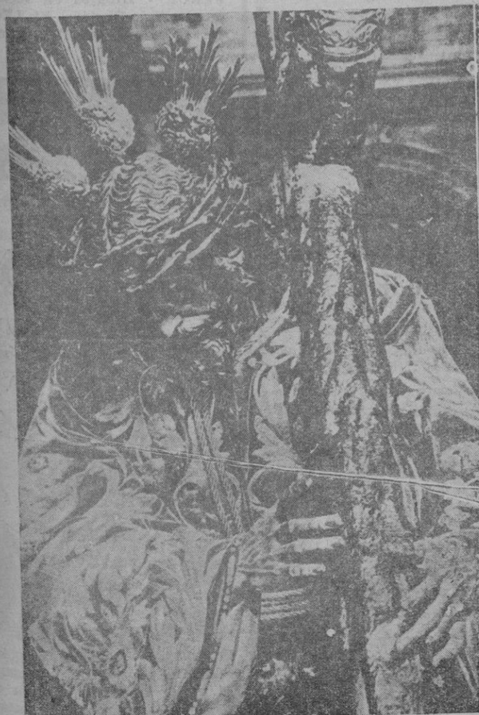
La famosa imagen, obra prodigiosa de Martínez Montañés, de Nuestro Padre Jesús de la Pasión

cant els seus volums de "Visions de Catalunya", dels quals ens hem ocupat successivament en el nostre "Breviari". Els tres volums sobre la Catalunya Nova i la Catalunya Vella han anat seguits de la publicació del nou volum, fa poc aparegut, sobre Mallorca (1). Davant de les "visions" de Mallorca em torno a afirmar en