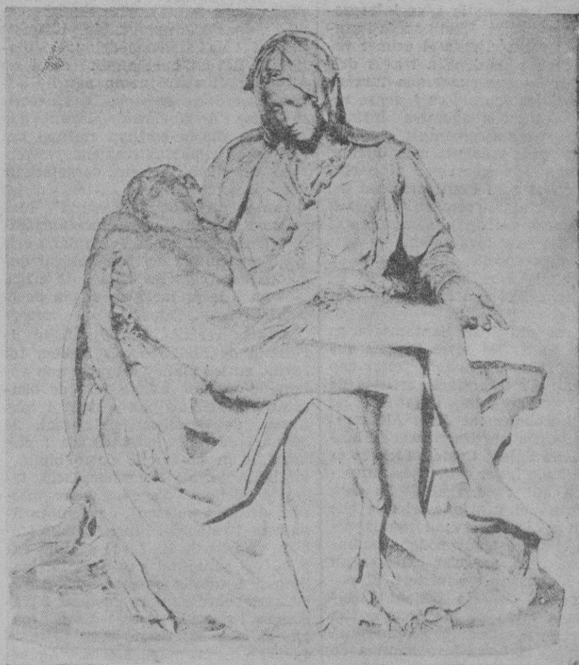
"La Piedad", famosa escultura de Miguel Angel