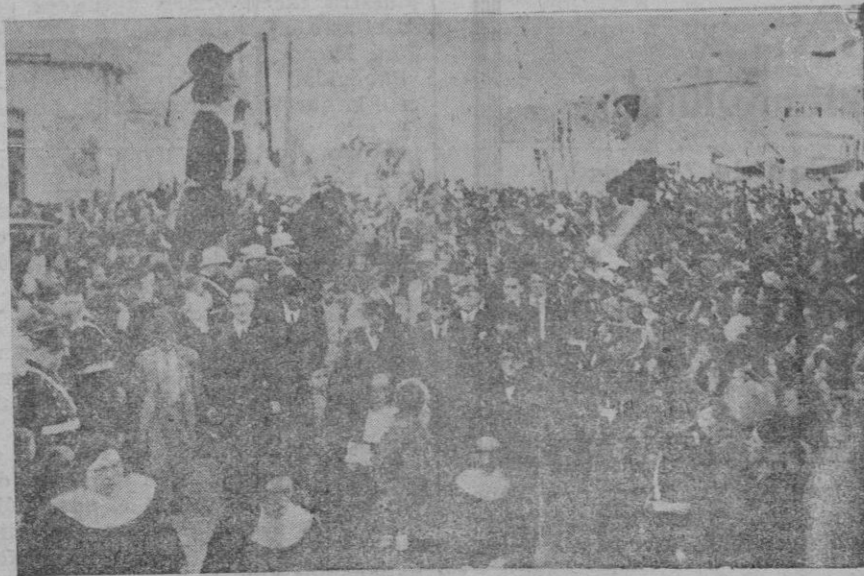
Las Autoridades en el momento de inaugurar la Feria de Ramos