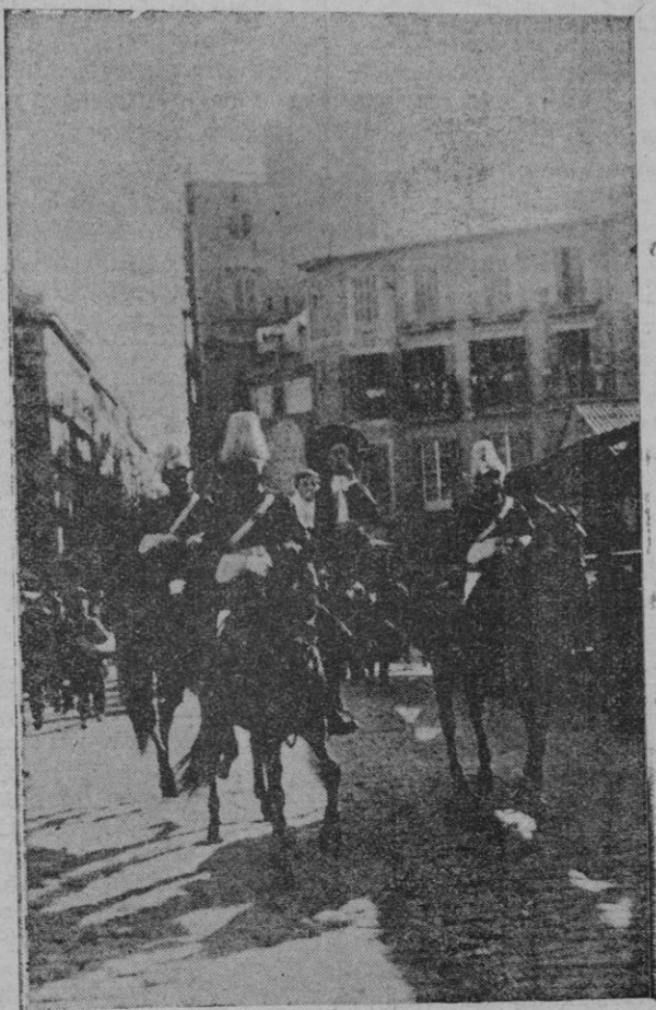
La comitiva dirigiéndose a inaugurar la feria de Ramos

Publica además: Cómo se realizan los asentamientos en Ciudad Real: Qué son los yunteros y cómo se les reparte la tierra. — La Pasión de Nuestro Señor, representada por el pueblo de Esparraguera. Interesante personalidad de los actores. Anás y Caifás, revolucionarios. — La novela de amor de Anita Delgado. — El terrorismo contra la autocracia en Rusia (continuación). — Deportes. — Actualidades.