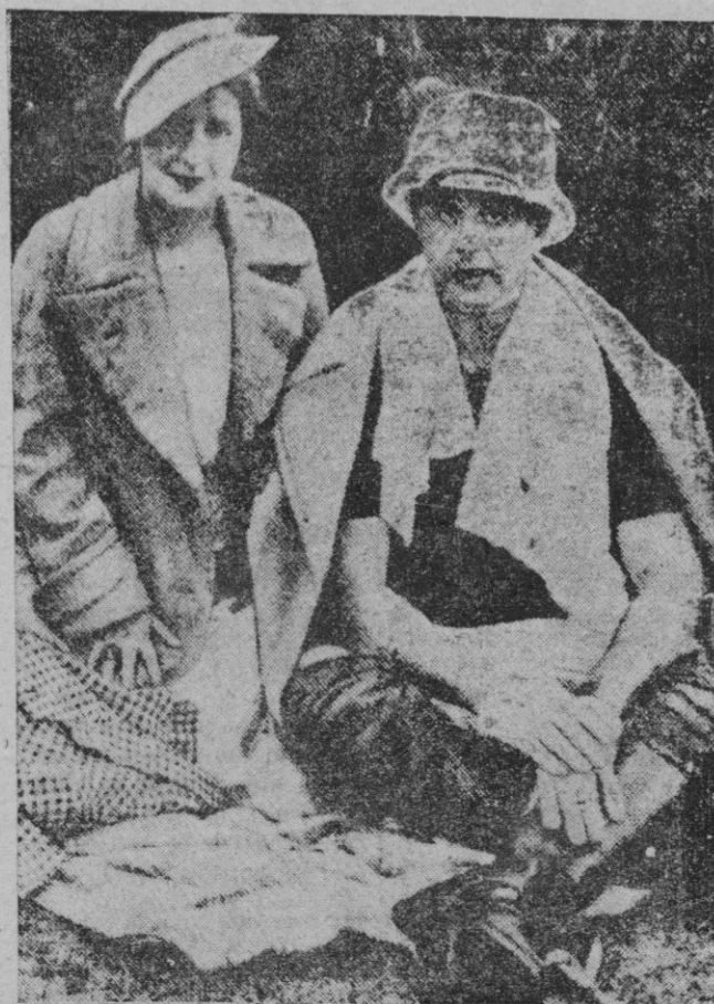
El príncipe Sergio Mdivani que murió al caerse del caballo durante un partido de polo, acompañado de su esposa

BALEAR Lunes, 23 CATCH-AS-CATCH-CAN La lucha de la emoción