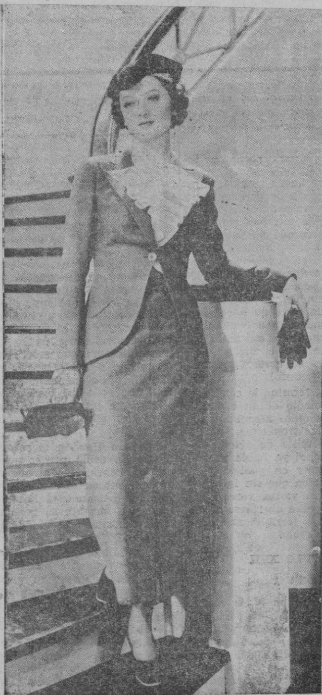
Myrna Loy, estrella de la Metro-Goldwyn-Mayer, tal como aparecerá en una próxima película, luciendo una de los últimos modelos de la moda

Planas efectúa un pase a Alzamora, logrando éste lanzar un centro sobre