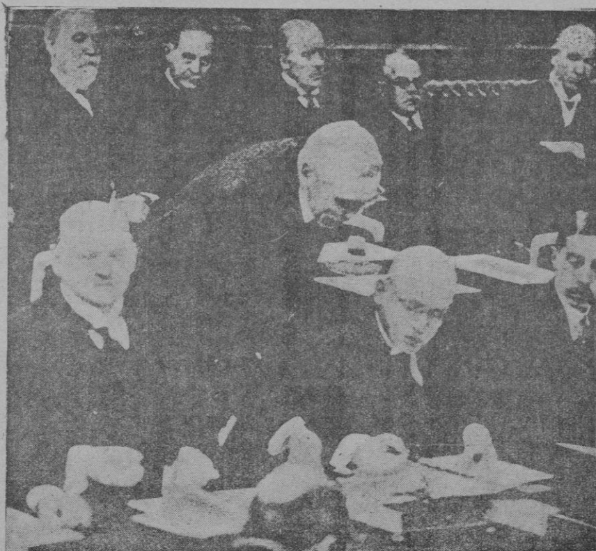
Locarno, 1925. — Los representantes de las potencias interesadas — el segundo de la izquierda es el señor Stressemann — asisten a la firma del tratado ahora denunciado

En el desarrollo de este programa las clases proletarias conseguirían todos los mismos avances que a juicio del