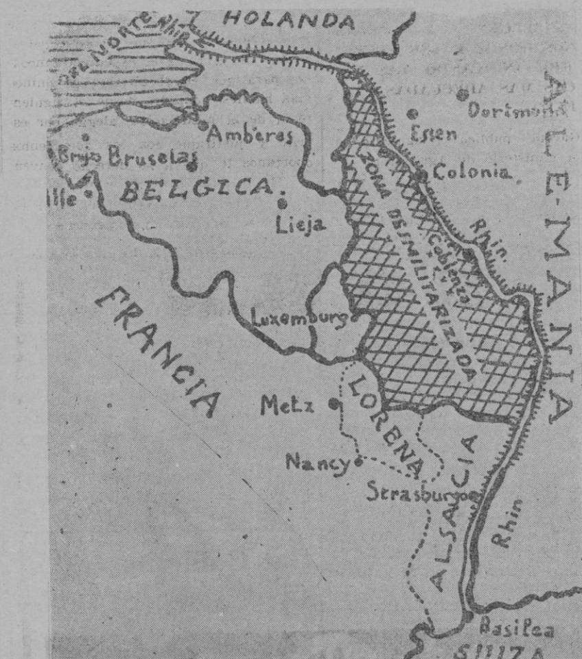
La zona desmilitarizada según el tratado de Locarno que se comparaba de la frontera francesa las fuerzas alemanas, ahora ocupada por los ejércitos teutónicos

Servicio especial de tranvías Más detalles por carteles y programas Mañana, viernes, por la noche grandes partidos y quinielas.