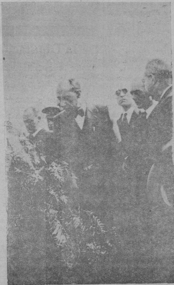
El Sr. Alcalde después de colocar la primera piedra de la escuela de los Hostalets