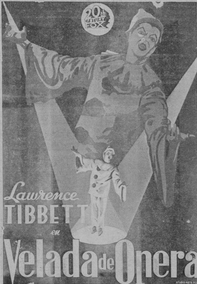
UNA MARAVILLOSA PRODUCCION CON UN BRILLANTE CONJUNTO DE ARTISTAS DE LA OPERA Y LA ESCENA DIRIGIDA POR DARRYL LAMECK