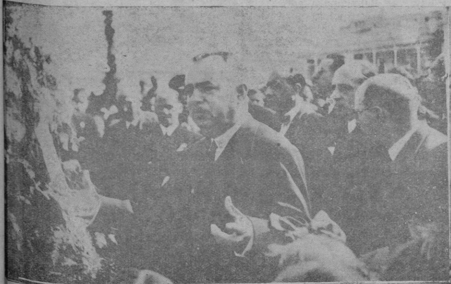
El Sr. Capó dirigiendo la palabra a los escolares en la colocación de la primera piedra en Los Hostalets