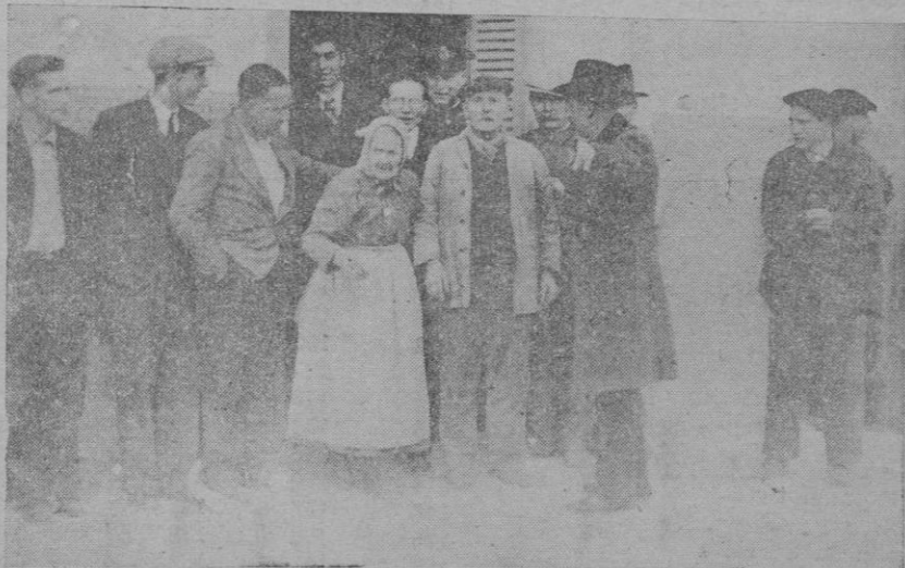
Una anciana saliendo de votar