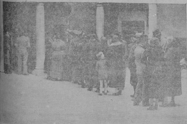
La cola de votantes en el colegio de San Antonio de Viana

Mi propósito, añadió, es obrar con la más recta justicia, y desearo de dar un estado de normalidad, no he tenido inconveniente en autorizar una manifestación, para la que se