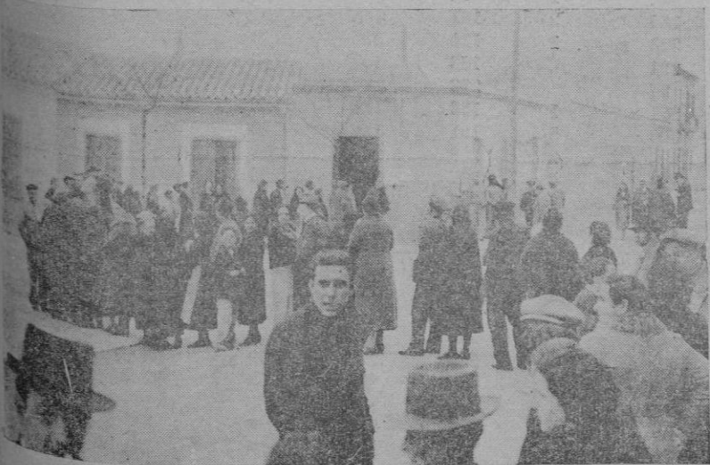
Cola de vitantes en el colegio de la calle del Capitán Vila