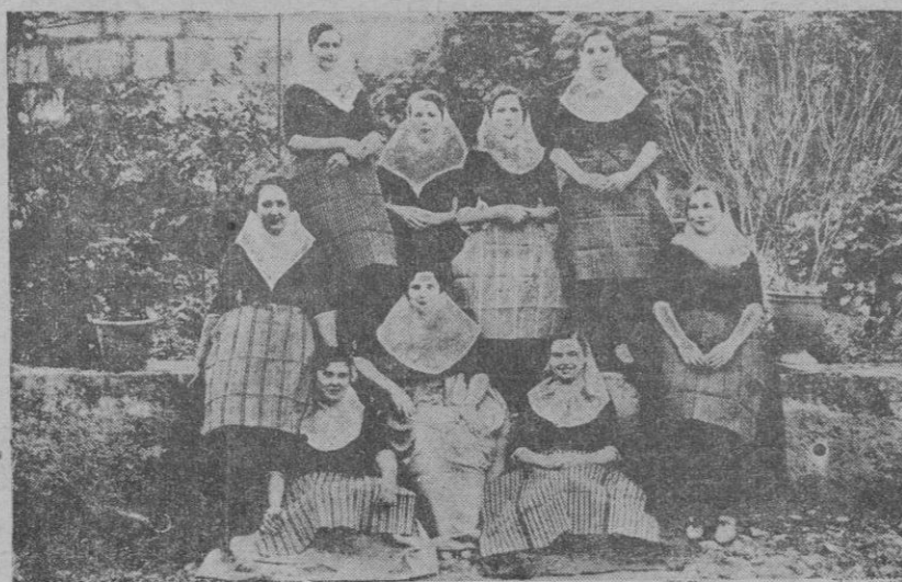
Típicas payesas de María de la Salud que han dado tres funciones en el salón de Acción Católica