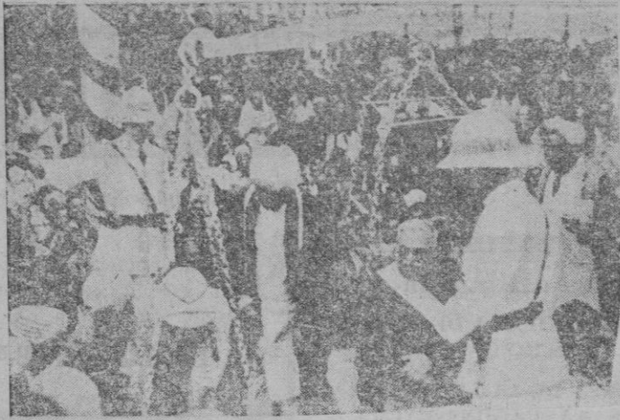
El Aga Khan ha celebrado en la India su jubileo de oro. Su peso en el rico metal lo entrega para obras caritativas