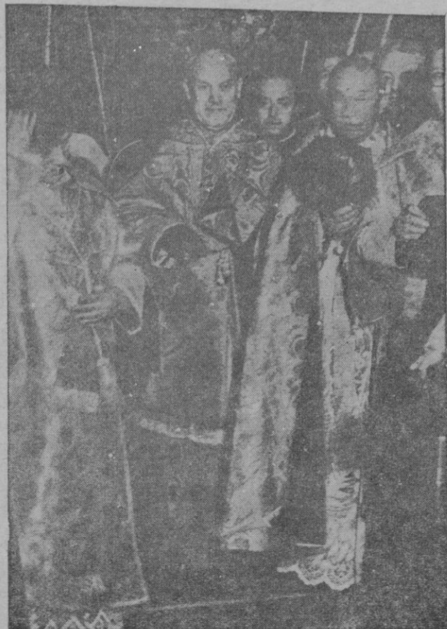
Su Eminencia el cardenal arzobispo de Toledo, doctor Gomá, en el solemne momento de su entrada, bajo palio, en la iglesia catedral primada

Cierto que Inglaterra, como los Estados Unidos, como Rusia, se dan perfecta cuenta de los propósitos de Tokio y todos saben la enorme amenaza que encierra, pero ninguno de esos poderosos Estados se decide aisladamente a correr los terribles riesgos de una lucha armada en extremo Oriente, que vendría en beneficio inmediato de los otros dos.