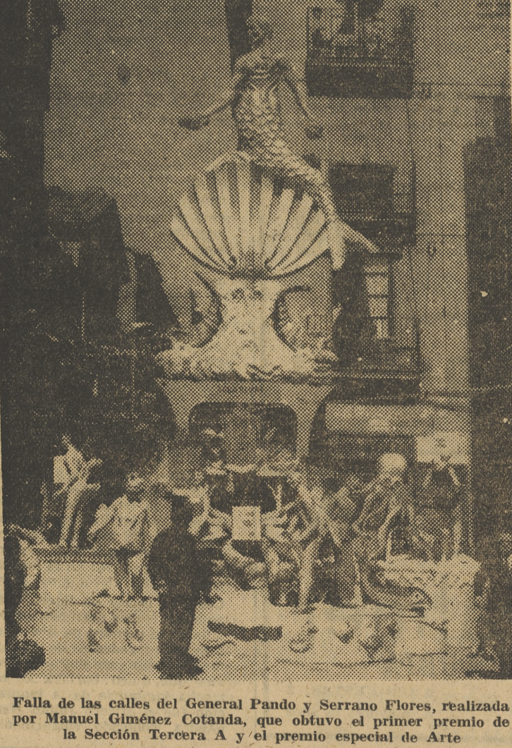
Falla de las calles del General Pando y Serrano Flores, realizada por Manuel Giménez Cotanda, que obtuvo el primer premio de la Sección Tercera A y el premio especial de Arte