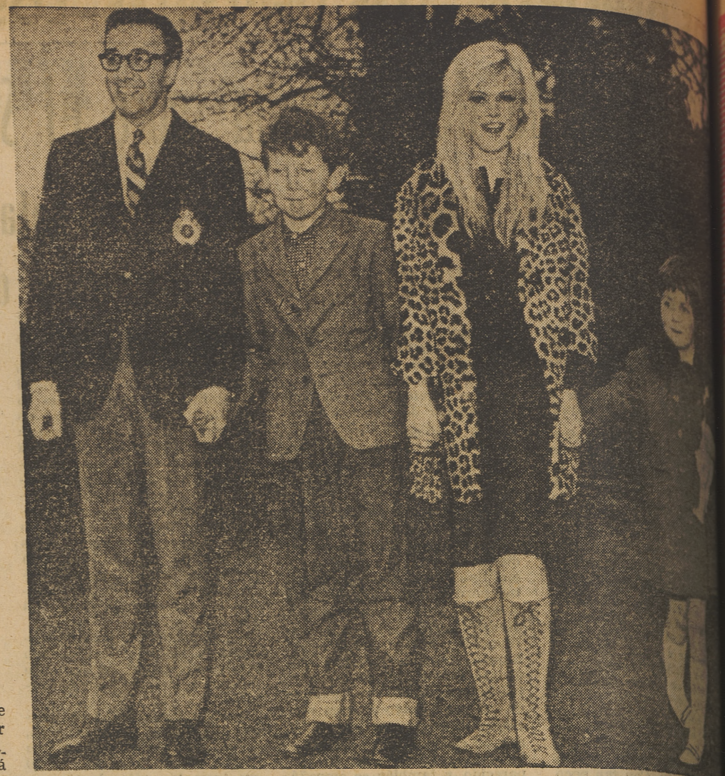
Peter Sellers ha sido víctima de un súbito flechazo de Cupido. Se enamoró de repente de Britt Eklund. Y recurrió al expediente de declararse por medio del Telstar...

Ya está a punto el traje blanco confeccionado por Hartnell, el modisto de Isabel II, y Britt, dice que está segura de que a su lado Sellers va a recobrar la tranquilidad. Así sea, pero la vida no es una película y en un noviazgo tan original, no hay tiempo para una penetración base de la futura estabilidad.