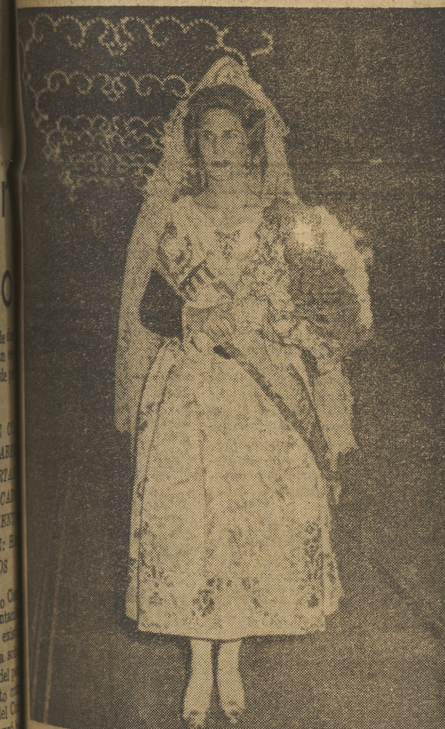
La bailera de Alba, vistiendo el traje típico de «labradora», participó en el brillante acto de la Ofrenda, como fallera mayor de la plaza del Mercado.