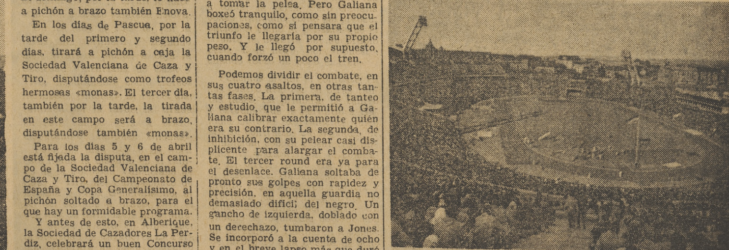
El Népstadion, donde se disputará el partido Ujpest-Valencia