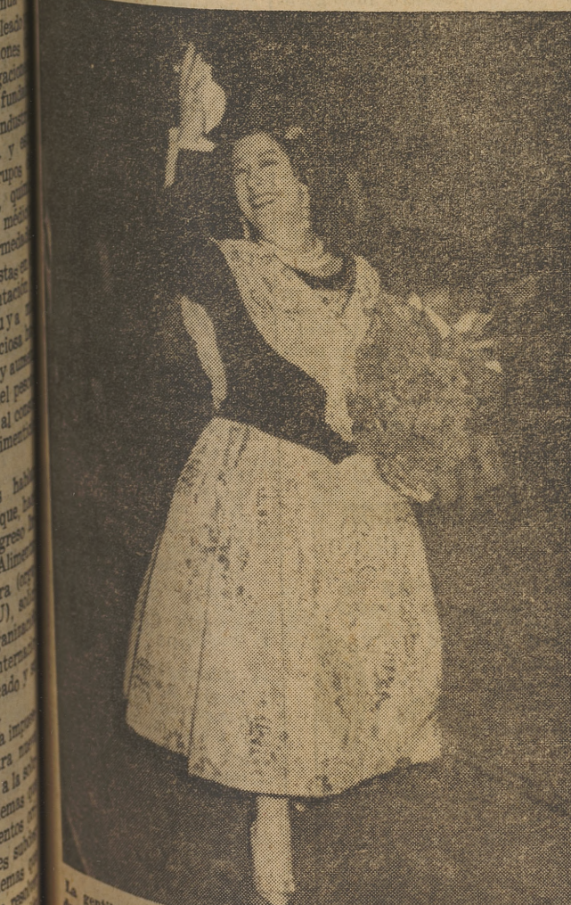
La guapa y popular artista valenciana Conchita Piquer, encuadrada en la representación femenina de la falla de la plaza del Mercado, también tomó parte en el desfile de la Ofrenda.