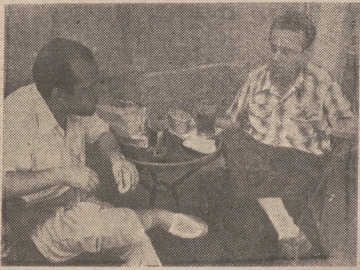
Un "mano a mano" de bocadillos y cervezas, entre dos "viudos de verano"

—El de filete de ternera, que vale 650 pesetas. —¿El más barato? —El de calamares fritos, a 3'25 pesetas. —¿El que más le deja a usted? —Sin duda alguna, el de lomo. —¿Cómo calcula usted la cantidad de panecillos? —Es difícil. El sábado, por ejemplo, me sobraron 150. —¿Qué hace con ellos? —Los vendo a particulares, a precio más barato. —¿Le supone esto una pérdida considerable? —Nunca. Además, es neces-