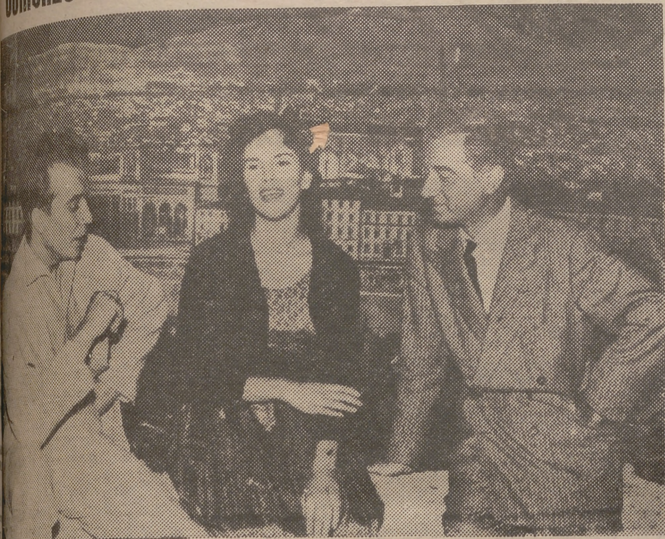
En los estudios D'Epina, cerca de París, ha comenzado el rodaje de la película «El tiempo del amor» dirigida por Georges Lacombe. Claude Dauphin hace el papel de un decorador, y es el protagonista de la joven vedette italiana. Antonella Luaidi, y de Philippe Lamaire. En la foto vemos, a la izquierda, a un decorador que representa a Florencia, a Antonella Luaidi rodeada de Philippe Lamaire a la izquierda, y Claude Dauphin a la derecha.