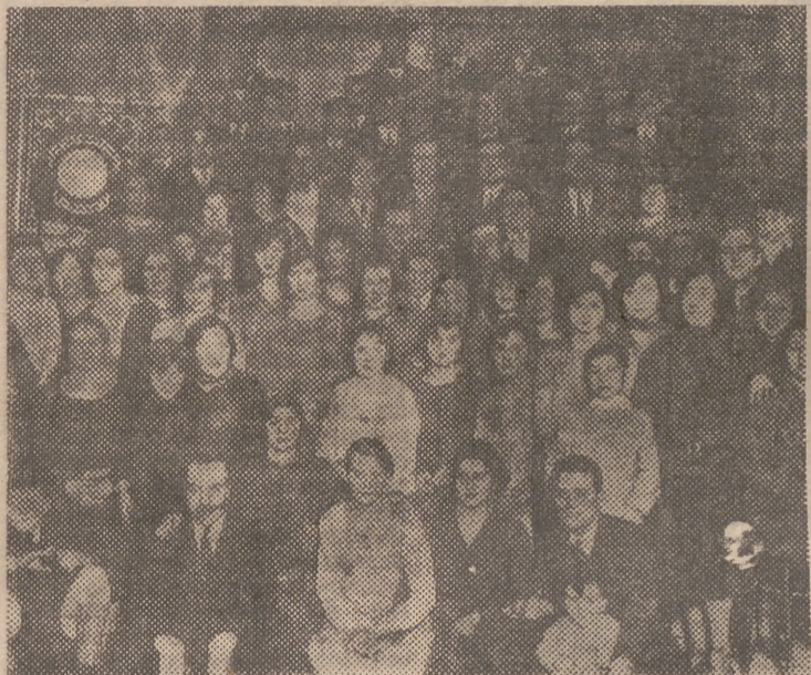
Fotografía de un grupo de socios del antiguo «Centre Catalá» de la calle de la Victoria. la fotografía data de 1929.

nos. Más tarde, la cobra de Reus hizo que se reunieran de nuevo, con lo que se dio el golpe certero para que no se acabaran las sardanas en esta tierra. Primeramente se celebraron con discos y altavoz en el patio del Colegio de los Padres Dominicos. Poco después empezaron las sesiones en el local del Centro Cultural Tomista, hasta que, en agosto de 1951, estos preliminares tuvieron su germinación en el salón del mismo colegio de los Padres Dominicos, donde quedó establecida definitivamente la Casa de Cataluña. Siete meses tardó en inaugurarse el local, y se hubo de continuar en el mismo Centro Cultural del convento de los Dominicos, tan ligado a esta agrupación regional.