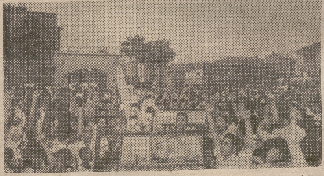
TAIPEH.—Se rindió por el vecindario de la capital un homenaje de bienvenida a los aviadores que triunfaron en la batalla aérea librada contra los comunistas chinos. He aquí un aspecto