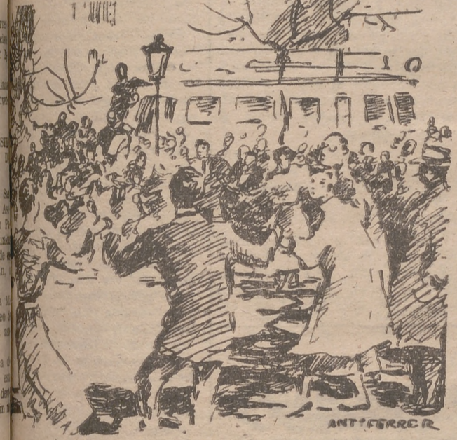
Sardanas en la Glorieta

COFRADIA DE LA VIRGEN DE MONTSERRAT Si hay alguna cosa que atraiga la mirada de un catalán,