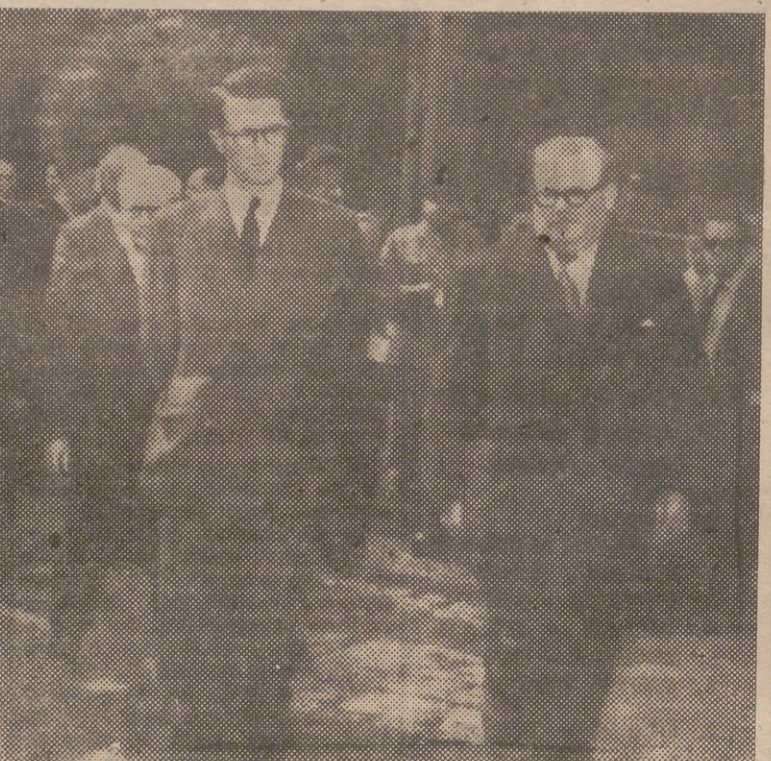
Por segunda vez en 48 horas, el rey Balduino, acompañado de M. Van Acker, fue a visitar la mina trágica.