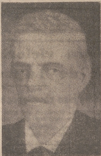
Fernández y González

Esto sólo da idea de la magnitud y del exceso de aquella imaginación y de aquella memoria privilegiada, fenómenos no extraños en quien como Fernández y González a los doce años escribía versos reputados como excelentes.