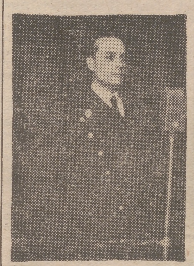
El ministro de la Gobernación, Don Blas Pérez González

Continúa diciendo el ministro que en desarrollo de los planes que figuran en la ley se hace un examen muy prolijo de los mismos, teniendo en cuenta que han de ser municipales, comerciales y provinciales, para terminar en el plan general social. No pretendemos poblaciones grandes ni pequeñas, sino intermedias, de 50.000 a 100.000 habitantes; protegemos al campo, las vías de comunicación y