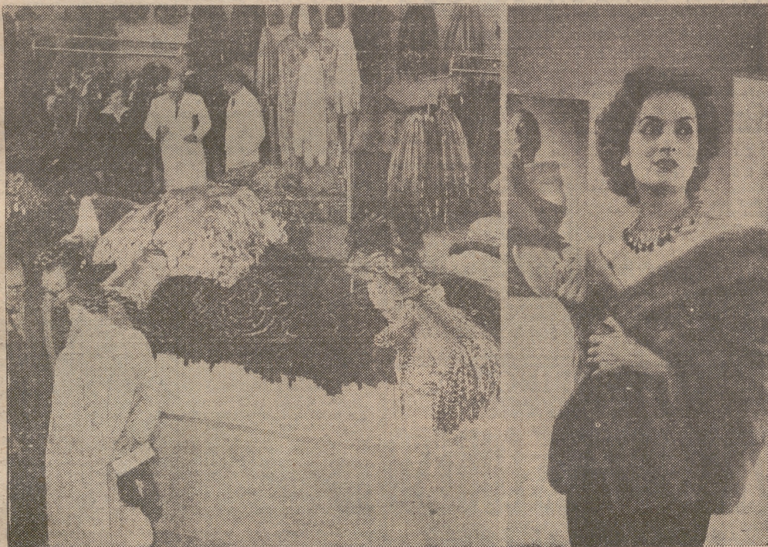
FRANKFURT.—En la segunda quincena del mes de abril se ha celebrado en Frankfurt la VIII Feria del Tabaco, Cigarrillos y Peletería, con participación de las más importantes industrias alemanas y muchas extranjeras en esta especialidad. Durante la Feria hubo exhibiciones vallisimas de peletería, como las que muestra la foto.