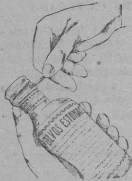
Fig. n.º 3

En su parte lateral, adaptada al cuello de la botella, se ha practicado un corte con dos puntas, que, tirando por cualquiera de ellas, quedará la cápsula convertida automáticamente en un tapón de rosca. Véase figura n.º 3 y 4.