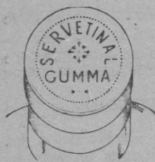
Fig. n.º 1

Esta cápsula es plateada por los lados y granate en su parte superior, con una inscripción en relieve formada por el mismo metal de la cápsula que dice "SERVETINAL GUMMA"; la palabra SERVETINAL de forma circular y la palabra GUMMA recta, debajo de la que dice SERVETINAL . Véase figura n.º 1.