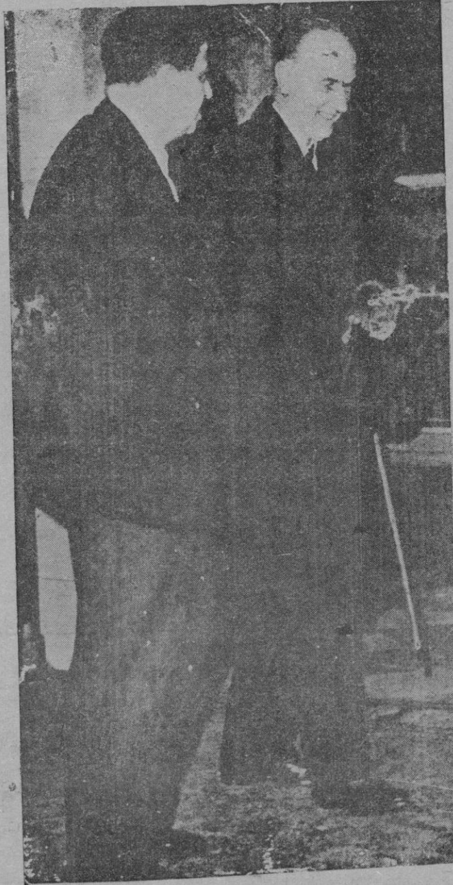
El ministro de Negocios Extranjeros de Inglaterra, mister Hoare, con el Jefe del Gobierno francés M. Laval, después de la conferencia en la que sentaron las bases para la proposición de paz al señor Mussolini