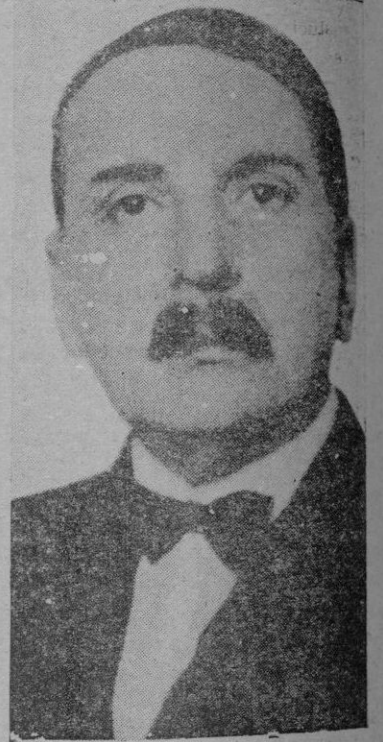
D. Enrique Larreta, que con gran éxito ha estrenado en el Español de Madrid, "Santa María del Buen Aire"

Por algo se empieza. Son una promesa, y los aplausos que escucharon