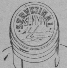
Fig. n.º 2

Esta cápsula será plateada o sea del mismo color natural del estaño; en su parte plana superior o cabeza ostentará una inscripción en relieve formada con tinta de color encarnado que dirá "SERVETINAL GUMMA" y debajo de esta inscripción la firma del autor. Véase figura n.º 2.