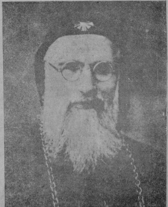
El arzobispo sirio-católico de Levante, que acaba de ser nombrado cardenal. Es el primer prelado oriental que es elevado al purpurado

por tres partidos: el de los "wighs" o liberales, el de los conservadores o "tories", y el radical que era el árbitro de la política, y la determinaba ya inclinándose a un lado, ya a otro. En 1867, los antiguos "wighs" se unen a los radicales bajo la dirección de Gladstone. Quedan en la arena política dos partidos: el liberal y el conservador. Ambos rivalizan hasta la gran guerra en el empeño moderno de la reforma social. Primero, la presencia en el Parlamento de los radicales, que forzaba a los conservadores a hacer concesiones a las clases humildes por miedo a que