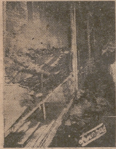
Dos aspectos de los destrozos ocasionados por el incendio

SOLUCION CARRABELAS. CAS. SALT. 6 — NAS. NA. BOA. SALT. SIMARRUBA. BIS. RAE. 9 — RBA. SALT. 7 — VA. ANOS. TAL. 5 — ROST. RA. RAR. 3 — MC. RAS. SENA. RI-