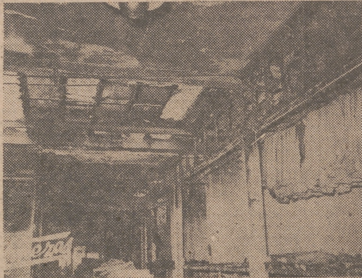
En esta foto puede comprobarse los daños sufridos en la misma claraboya de la fábrica.

El mencionado vigilante, presa de pánico, sintiendo los efectos de la asfixia, pudo correr hacia la puerta que comunica con el patio de entrada a la finca de vecindad, golpeando fuertemente, así como también contra la puerta metálica que da acceso a la calle, a cu-