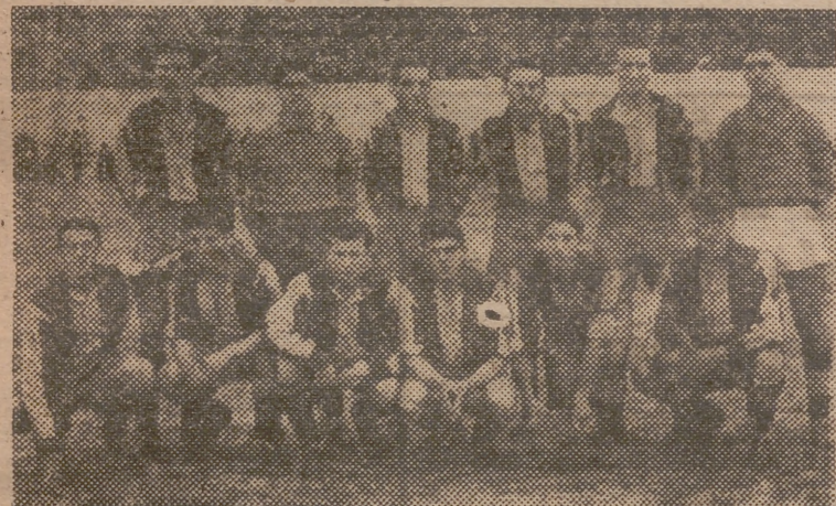
He aquí el conjunto del Burjasot, al que no le van nada bien las cosas en el presente campeonato. Los propietarios del Basot, fueron derrotados, el domingo, en su propio terreno, por el Utiel, después de haber estado dominando insistentemente los locales durante los noventa minutos de juego