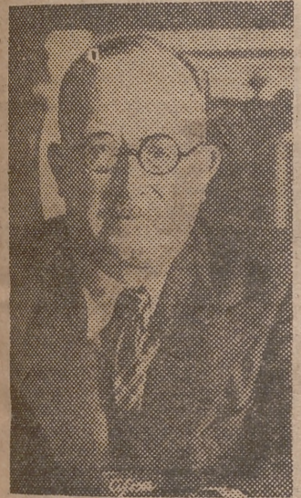
El presidente Auriol

La verdad es que los verdaderos candidatos se reconocen más bien por su silencio, por su modestia, por su gentileza, por el modo como se emplean en poner de su lado todas las ventajas, más que por sus proclamas. En esta lucha por el Eliseo es donde hay que buscar, por ejemplo, la explicación del eclipse de Queuille en el último congreso radical; de su negativa a aceptar otro Mi-