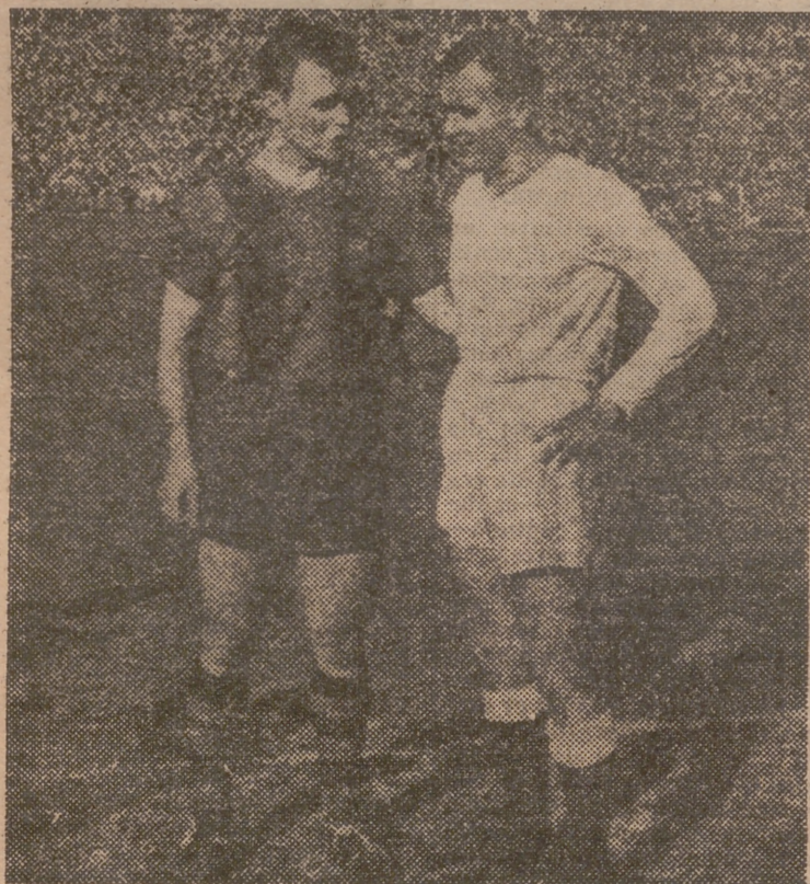
Aquí tienen ustedes a Kubala y Di Stéfano, mano a mano, en Chamartín, antes de que comenzara el gran encuentro Barcelona-Madrid, en el que el primero se llevó una paliza de antología. El suramericano le ganó la partida al ex húngaro de forma clara. Así, pues, en el primer round, Di Stéfano ganó por amplio margen de puntos