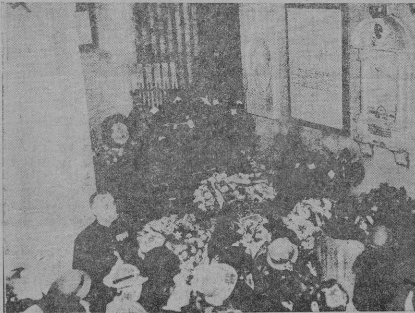
Londres. — La tumba del almirante Jellicoe, en la Catedral de San Pablo, junto a la de Nelson