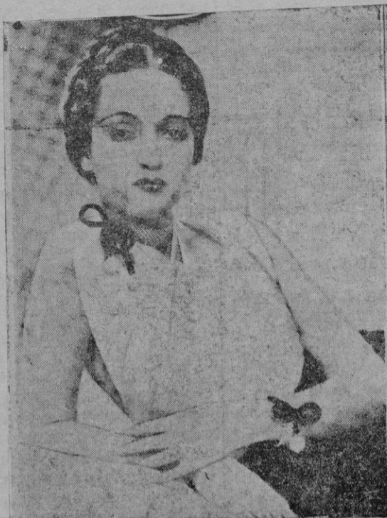
La opinión norteamericana se ha mostrado favorable a la mujer morena, de ojos de almendra y labios sensuales. He aquí un modelo

Ha instalado su despacho en la casa núm. 19 calle de San Francisco (esq. P. S. Francisco. Casa de Baños Mayol).