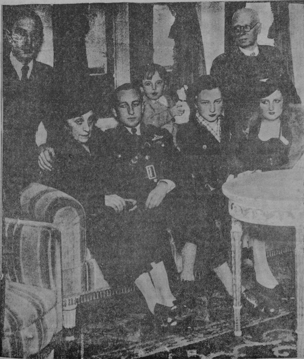
El aviador Pombo a su llegada a España, acompañado de sus familiares, que acudieron a recibirlo, en una cámara del buque

Inscripciones hasta el mediodía del sábado en el local social, Constitucion 34-40, Teléfono 2216.