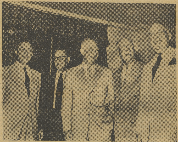
Eisenhower y sus cuatro hermanos con sonrisa de triunfo

La ciudad de Nueva York tributa al general una bienve-