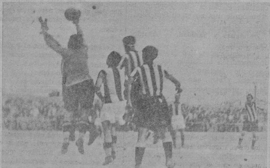
Comas, en oportuna salida, evita el ramet de cabeza de Sureda

Barceló y Oñate en la defensiva y la línea media animaron también con bonitas jugadas el juego y fué una verdadera desgracia de que no coadyuvaran a ello los delanteros, los cuales, hubieran podido apuntar sino dos puntos al menos con uno, ya que el empate hubiera podido ser el resultado que debía señalar el marcador al final, ya que tuvieron innumerables ocasiones de conseguir tantos especialmente por par-