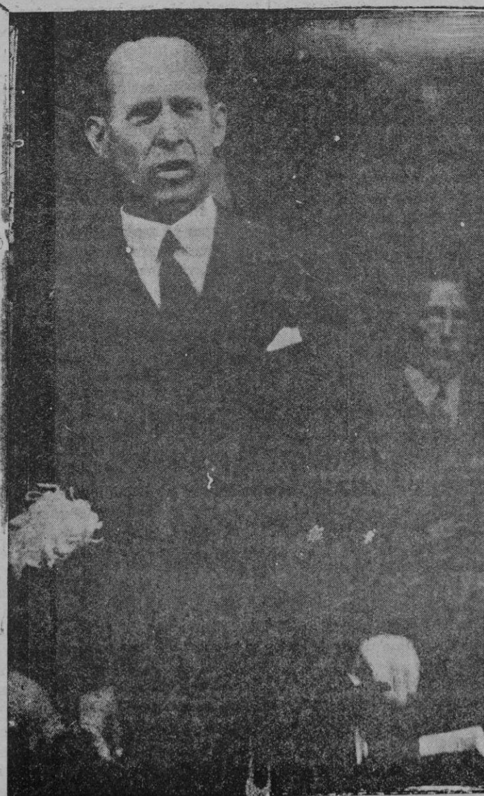
El ex-rey Jorge de Grecia, a quien se le ha ofrecido de nuevo la corona, pero que no la acepta sino va refrendando el ofrecimiento por un plebiscito favorable