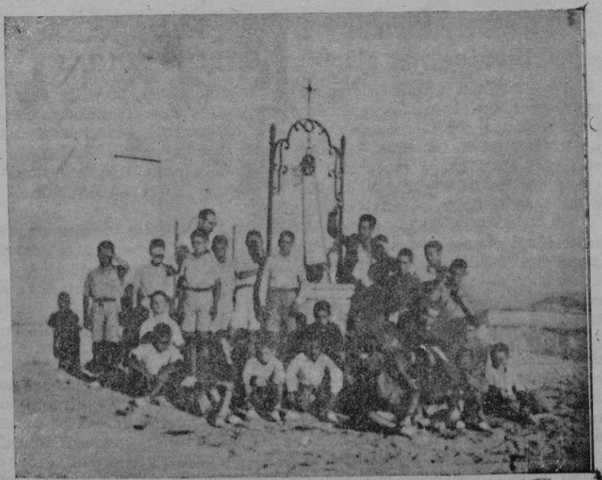
Colonia Escolar Provincial de niños en Bonany

Inca, 28 de Septiembre 1935.—El Secretario.