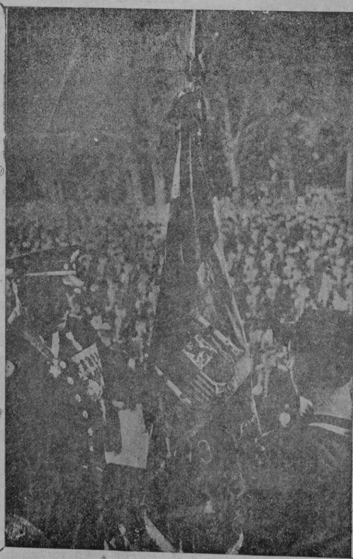
La señora esposa del ministro de la Gobernación haciendo entrega en Madrid de la bardera regalada por el Presidente de la República a las fuerzas de seguridad y asalto, al jefe de las fuerzas