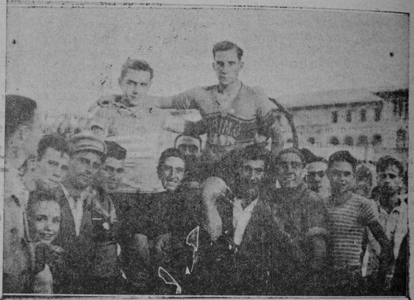
Los dos vencedores de la última etapa al llegar al Velódromo son paseados en hombros