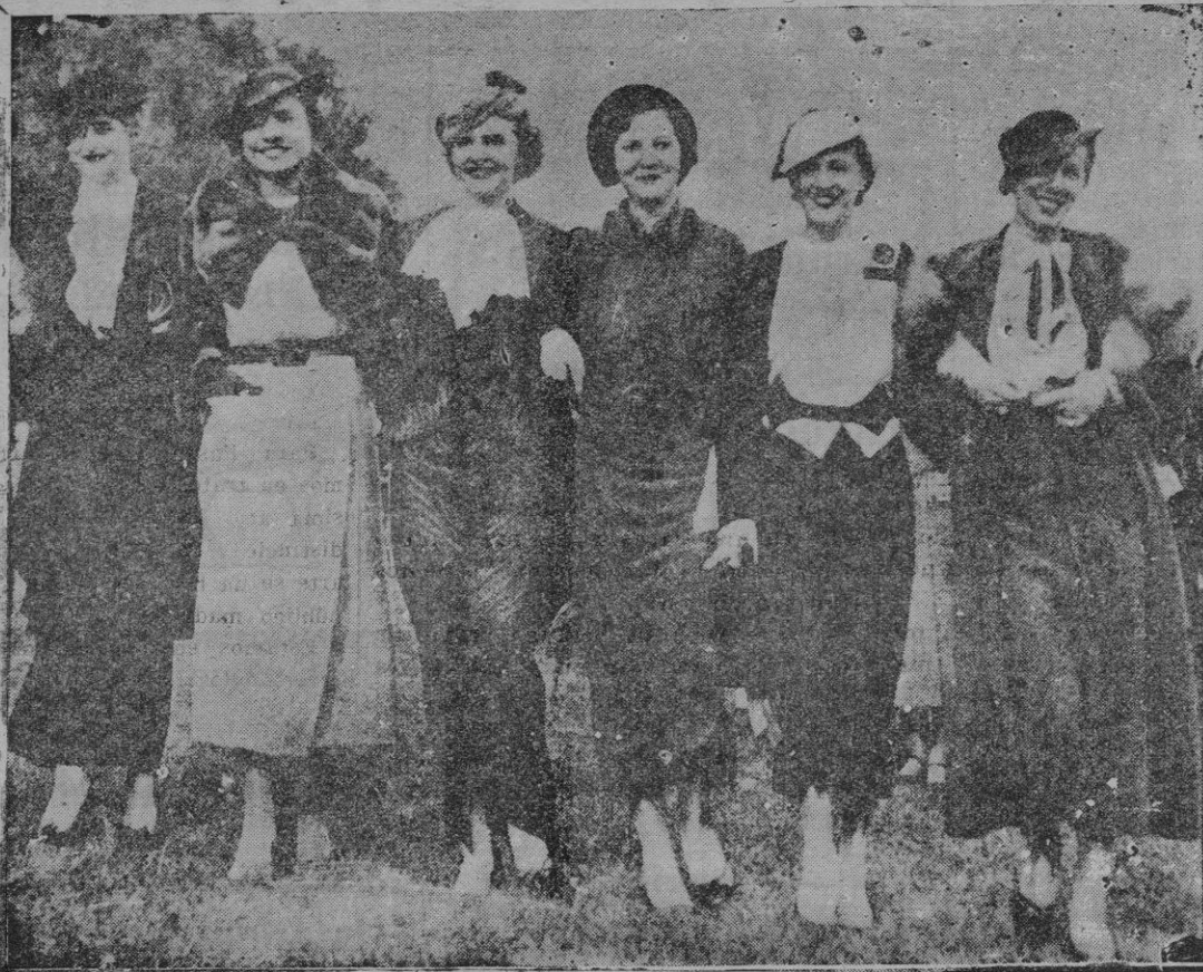
Las primeras modas de invierno, lucidas en el Hipódromo de Berlin