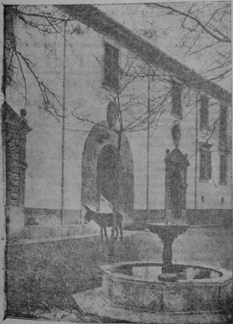
Palacio de Son Forteza (Puigpunyent), fotografía de Byne, con toda la sugerencia de un lienzo de Santiago Rusiñol

Para hoy viernes 27, a las nueve de la mañana, están anunciados los exámenes de Dibujo de todos los cursos, alumnos libres y oficiales, plan antiguo y moderno.