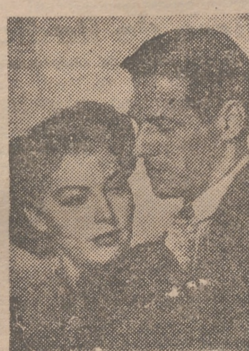
Mario Cabré aparece en este documento gráfico junto a Ava Gardner, en Londres, donde coincidieron con motivo del estreno de su película "Pandora y el holandés vo ador"