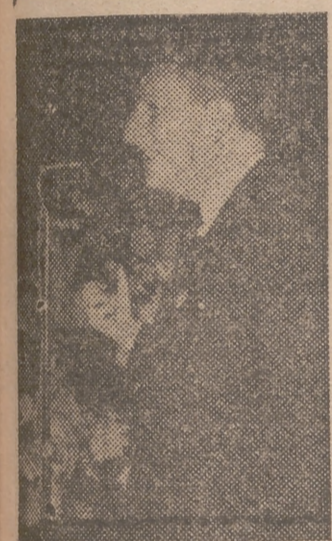
El gobernador y jefe provincial, señor Salas Pombo, durante su alocución a los católicos valencianos