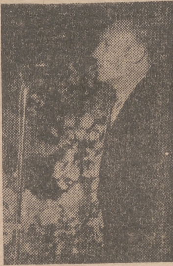
El alcalde de la ciudad se dirige a los fieles asistentes al Santo Rosario

Digno color de las misiones parroquiales del Rosario, celebradas en nuestra ciudad durante el pasado mes de octubre, fué el acto de ayer en la plaza de Tetuán. Miles de católicos valencianos, congregados por parroquias, se concentraron en esta popular plaza, presididos por los excelentísimos señores arzobispo, gobernador y altores, con los concejales, jerarquias y autoridades de la ciudad. Llegada la imagen de la Virgen, en la magna procesión organizada por los padres dominicos, dió comienzo el acto con el rezo del último misterio glorioso, que dirigió el señor arzobispo. Presentó después, con palabras de mucho afecto, a los oradores, excelentísimos señores alcalde y gobernador civil, quienes enervorizaron a los fieles con sus sentidos e inspiradísimos discursos. Cerró el acto el prelado para insistir en la devoción y práctica diaria del Santo Rosario en familia. Fué el acto de ayer una demostración palpable de la devoción mariana del pueblo valenciano, que sigue así como dijeron ayer los