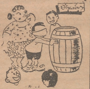
¡Ya te tengo! Eres tia Poli!

HORIZONTALES: 1. — TRASEGAR. 2. — OLAJE. 3. — ODA-NEV. 4. — BES. DO. NI. 5. — UNOS. LOS. 6. — TONINA. 7. — OJERA. 8. — SOPETEAR. VERTICALES: 1. — TRIBUTOS.