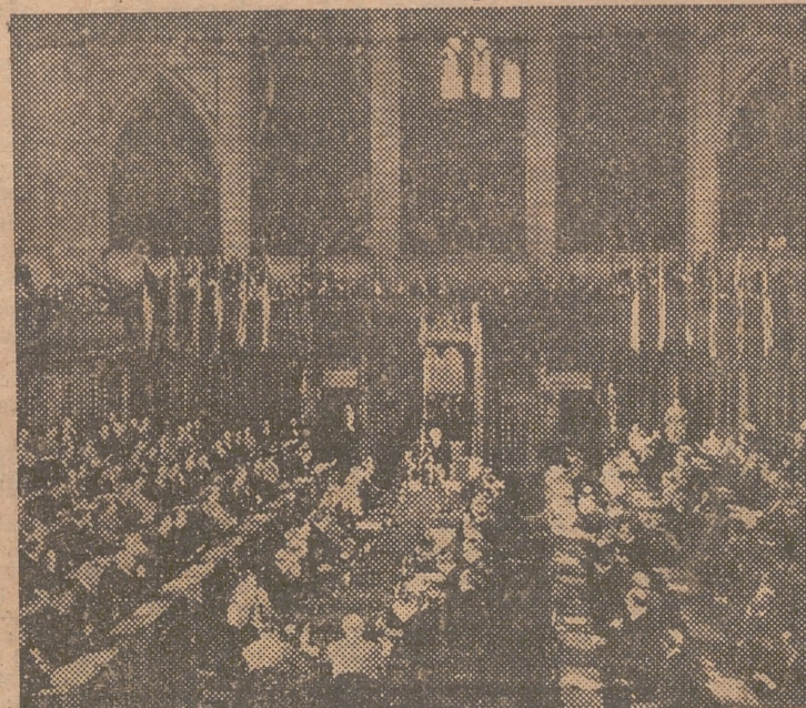
Una vista general de la conferencia del Consejo de la Organización del Pacto Atlántico, en Ottawa. Van Zeeland, ministro de Asuntos Exteriores de Bélgica se dirige a los delegados