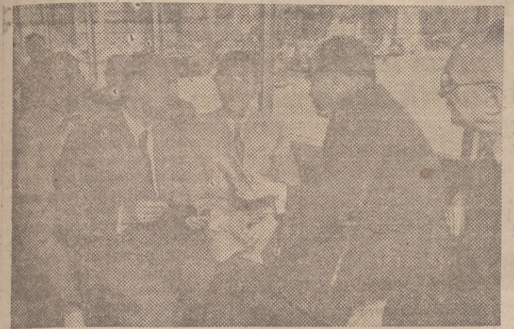
Ayer por la mañana y como ya informamos a nuestros lectores, fué inaugurada la primera línea de trolebuses de Valencia. En la foto aparecen el gobernador civil, el alcalde de la ciudad y otras personalidades en el interior del trolebús que realizó el viaje inaugural.