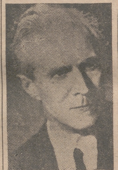
Sir Eugen Millington Drake

24, el sábado de Pascua, como siempre. Creo que es el mayor espectáculo deportivo que se celebra en el mundo con carácter libre, es decir, sin que se cobre entrada. La presencian todos los años unas doscientas mil personas desde las orillas del Támesis, en los siete kilómetros del recorrido desde Pountley a Montley. Por cierto que hoy en día resulta un gran problema atender a los gastos de entrenamiento y cada vez se resultan más onerosos a los dos clubs universitarios de remo. Para ayuda voluntaria venden unos programas oficiales con referencias y comentarios en la "muchedumbre" y siempre se allegan algunos fondos, aunque el problema siempre queda