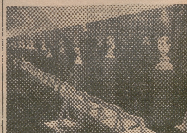
Un aspecto de la exposición de cabezas de cera inaugurada, ayer en el parador de la "Falla del Foc". La exposición permanece abierta al público en general desde las once de la mañana hasta las cinco de la tarde