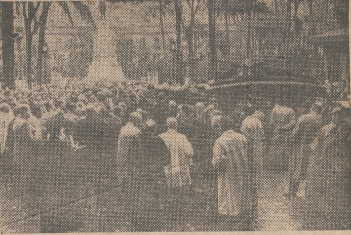
SEVILLA.—Momento de sacar del coche fúnebre los restos del teniente general Queipo de Llano, ante la Iglesia Parroquial de San Gil, en una de cuyas capillas fueron inhumados. El pueblo sevillano acompañó, en imponente manifestación de duelo, los restos de “su general” hasta la última morada