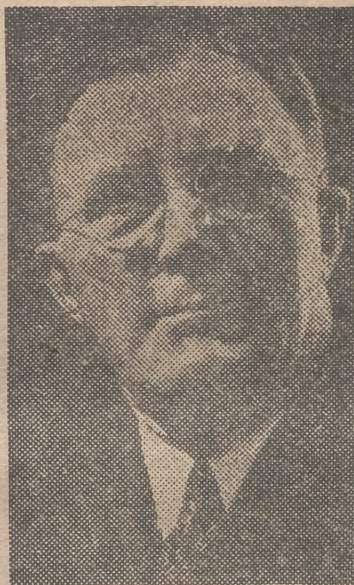
CHARLES E. WILSON General en jefe

Si los políticos del Kremlin son tan realistas como se dice —y hay muchos motivos para dudarlo, dadas las equivocaciones que han cometido— se habrán dado cuenta de un cambio de postura de Norteamérica —y en grado menor, del mundo occidental— que empezó hace unos tres meses, y que hoy es claro. Norteamérica ya no está a la defensiva, sino que ha pasado a la ofensiva. Quizás, este cambio se manifieste, por el momento, más en la disposición de los ánimos que en los resultados materiales, pero es un hecho con el que debe contar Moscú. Si quisiéramos una comparación histórica, podría decirse que los occidentales han pasado ya su Stalingrado y su Alamein, diplomáticos y de preparación psicológica.