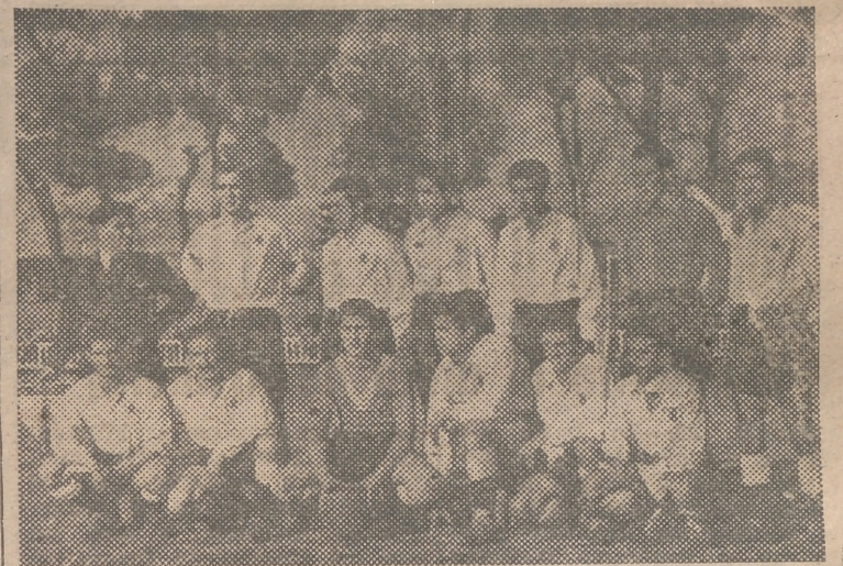
Equipo del Villarreal que se proclamó campeón regional de aficionados al vencer el sábado, en Vallejo, al Torrente, por dos a cero.