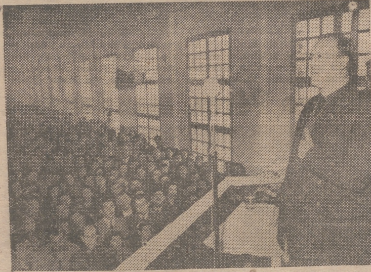
El delegado nacional de Sindicatos en su discurso a los obreros de la Cooperativa Zapatera de Almansa

del Ayuntamiento en pleno; jerarquías locales y vecindario en maso, que le tributó una cariñosa acogida. En esta cultura y laboriosa población, visitó el Grupo Sindical de Colonización número 302, entidad que está llevando a cabo trabajos de captación de aguas que afectan a 12.0000 hane-gadas. Este Grupo Sindical comprende un número de 800 agricultores, cuyas tierras mejorarán sus condiciones de producción en valor inestimable. El presupuesto de las obras en curso para el alumbramiento de aguas, sé cifra