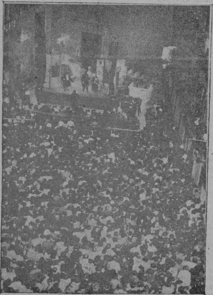
En Madrid se han dado las funciones populares con motivo del tricentenario de Lope de Vega. — La plaza del Conde de Miranda donde se representó "El degollado" con asistencia de numeroso público