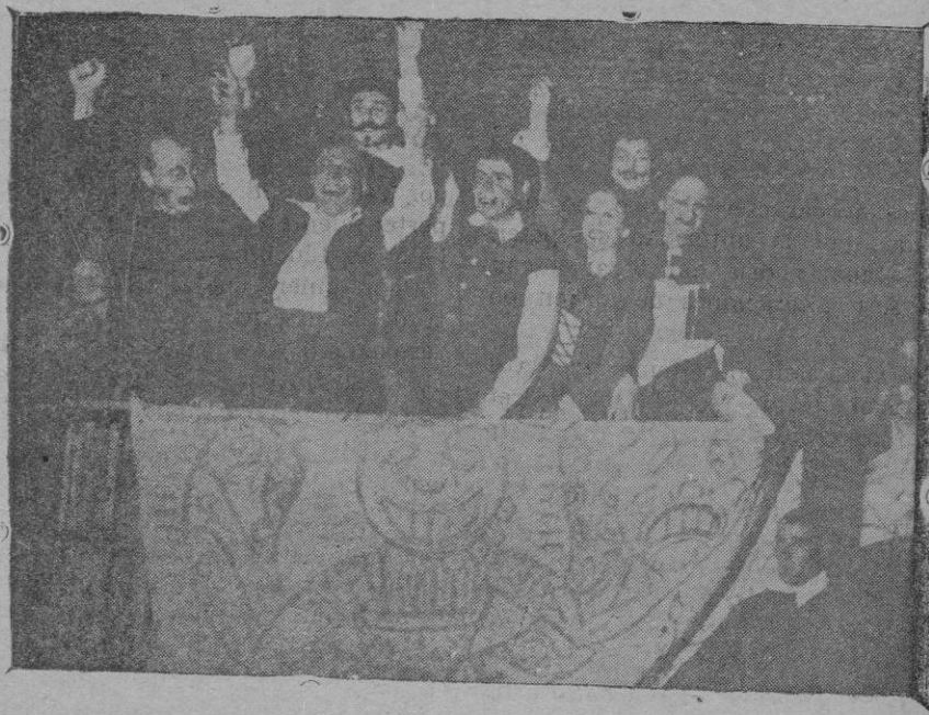
Los artistas que tomaron parte en la representación de "El degollado", de Lope de Vega, al llegar en el carro de la farándula a la plaza del Conde de Miranda saludan al público