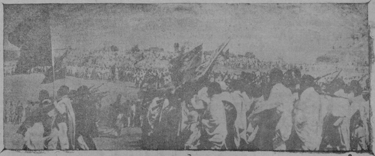
Tropas irregulares abisinas desfilando ante el pueblo

La empresa no supera, ni mucho menos, las posibilidades de una nación como la Italia actual. Por eso es aventurado pensar que una campaña como la que se anuncia será costosa, arriesgada por muchos conceptos y de duración imposible de prever. No es posible sustraerse al recuerdo de que a Francia le costó 50 años someter Argelia y 25 su zona de