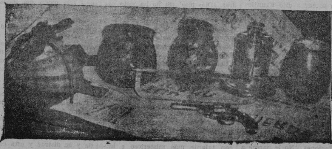
Los pucheros donde se habían escondido las alhajas robadas en la catedral de Pamplona