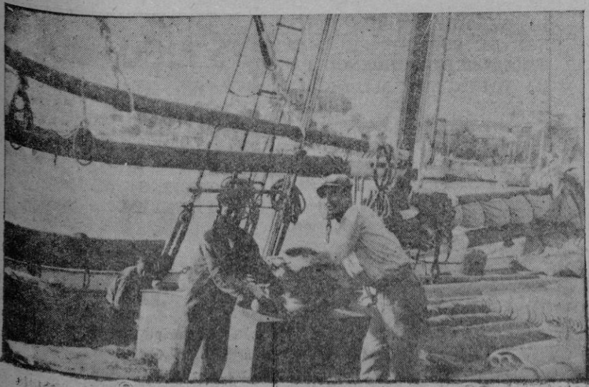
...ha llegado un barco cargado de “olles i greixoneres”...