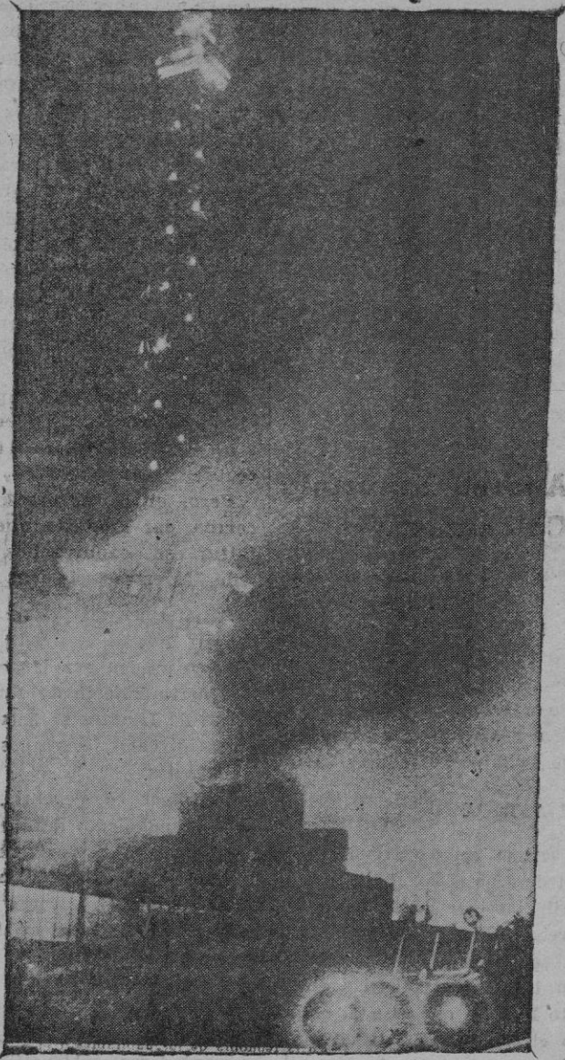
La torre del palacio de Televisión de Berlín rodeada por las llamas que destruyeron grandes salas de la exposición ocasionando víctimas

llas, mientras el Japón se proclama campeón de las razas de color.