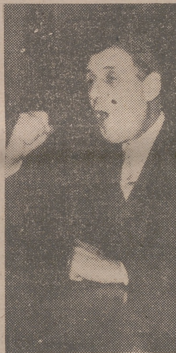
DE GAULLE La tempestad aproxima

El general quiere un ejército que pertenezca a Francia y que esté mandado por franceses. Y no espera la salud de su país de las ayudas ajenas, sino del esfuerzo propio. Por eso señala como programa militar «quince divisiones, por lo menos, permanentemente, cuarenta en la movilización, elementos destinados en cada región a asegurar en tiempo de guerra la defensa inmediata y la seguridad, todo esto cubierto por 5.000 aviones; el tonelaje naval requerido y las fuerzas aeronavales necesarias para proteger nuestros puertos y nuestros convoyes esenciales; por último, el poner en pie,