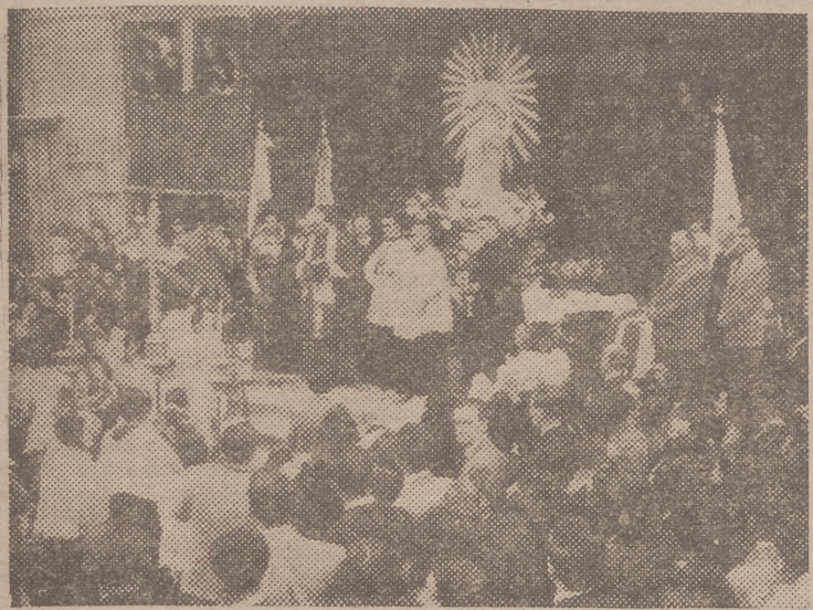
Bendición de la imagen de la Inmaculada Concepción, para la Parroquia de S. Francisco de Borja

En la iglesia de la Casa de Beneficencia tuvo lugar ayer, a las ocho, el acto de la bendición de la imagen del Santísimo Cristo del Amparo y del Perdón, con destino a la parroquia del Carmen. La imagen es obra