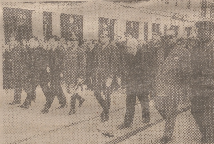
Nuestras primeras autoridades presidieron el entierro

El cortejo fúnebre se detuvo a la puerta del templo del Buen Pastor, donde fue rezado un responso. Al llegar a la plaza del Pintor Segrelles, fue rezado otro responso, en cuyo lugar se dispuso el duelo. Después acompañaron a los cadáveres hasta el cementerio, nuestras autoridades y una gran multitud.