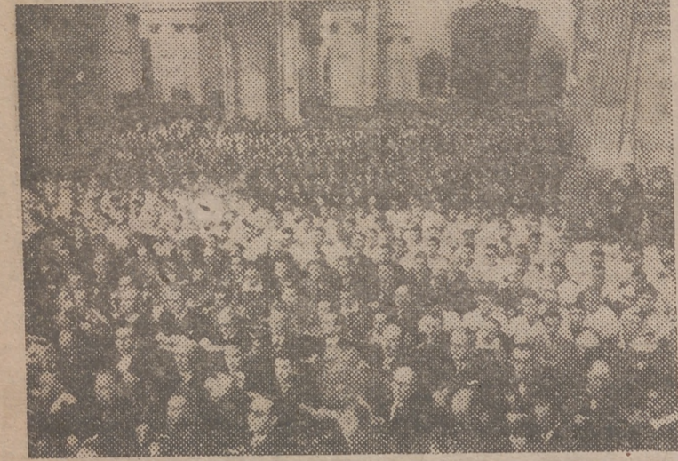
Imponente aspecto que ofrecen las naves de la Catedral, durante la ceremonia de la consagración episcopal del obispo de Coria.

A los postres, el señor Contreras pronunció unas acertadas palabras para ofrecer el homenaje y manifes-