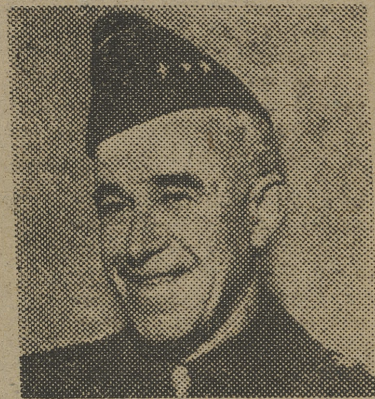
BRADLEY El ejército es la conciencia

Sin embargo, hay dos motivos fundamentales para que se concedan estos créditos. Uno de ellos, es que el Pacto del Atlántico quedaría en nuevo «chiffon de papiés», sin la fuerza necesaria para hacerlo respetar. Esto ha sido el fondo del