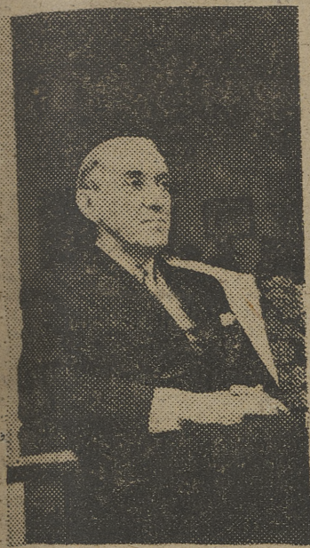
MADRID. — El ilustre escritor, fotografiado en el hotel donde se hospeda, poco después de su llegada a esta capital