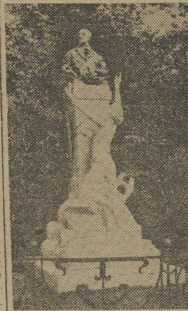
Monumento a Bruckner

tar aquellos y enriquecerlos mediante injertos contrapuntales. Con estos cortes por una parte y aditamentos por otra, debidos a los directores Löwe y Schalk, se hicieron ediciones de la música de Antón Bruckner. Para este compositor —cuyos defensores entablaron descomunal batalla con los partidarios de Brahms—, la orquesta es una materialización de la idea armónica en actividad. Idea que en su expresión posee un