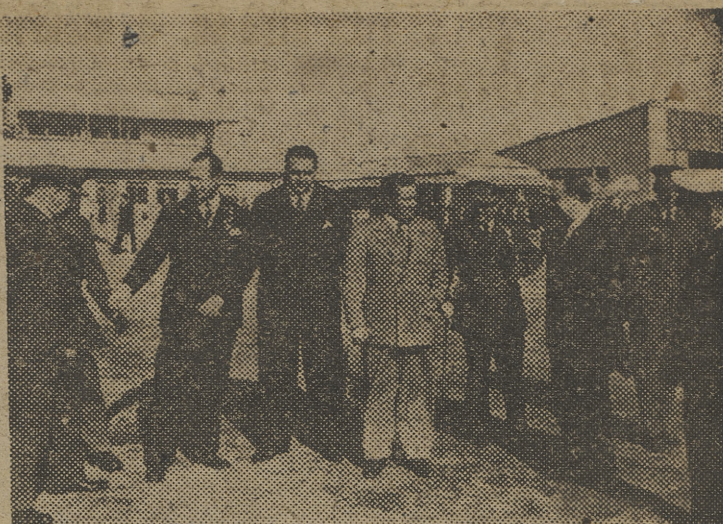
Momento de la llegada a Madrid del ministro del Aire, señor Gallarza, que fué recibido por los ministros de Asuntos Exteriores, Justicia, el embajador de la República Argentina y otras varias personalidades