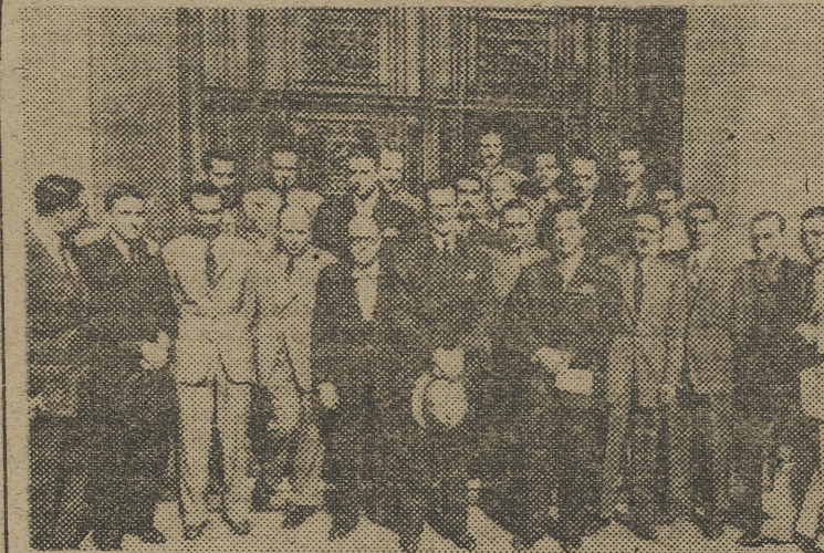
Los congresistas de la reunión luso-española de Neurocirugía