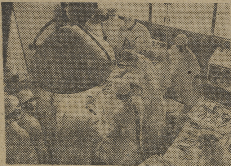
Un momento de la sesión operatoria en el servicio de Neurocirugía del profesor Barcia Goyanes.