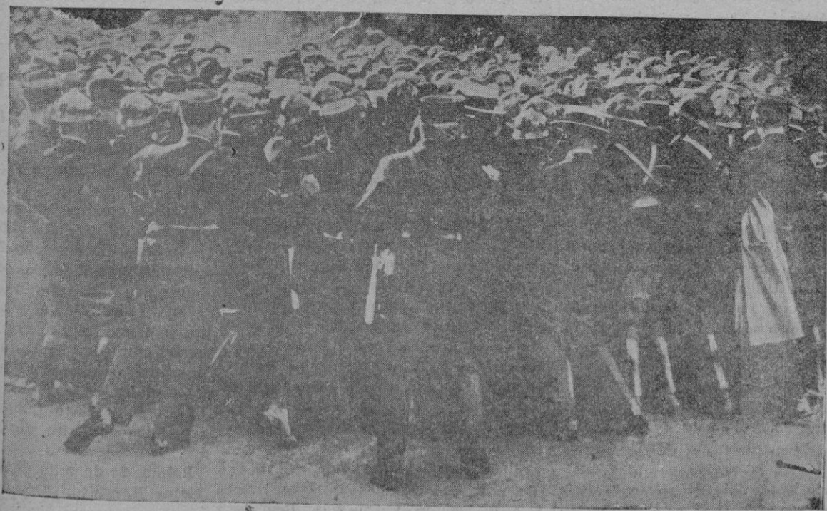
La manifestación de protesta de los funcionarios franceses en París contra la reducción del diez por ciento de su sueldo, una de las medidas del gobierno Laval, para salvar la economía francesa

Se vende casa amueblada y sin amueblar calle 14 Abril, con jardín, vista al mar, agua en abundancia y demás comodidades. Razón: Sindicato, 28, 2.º