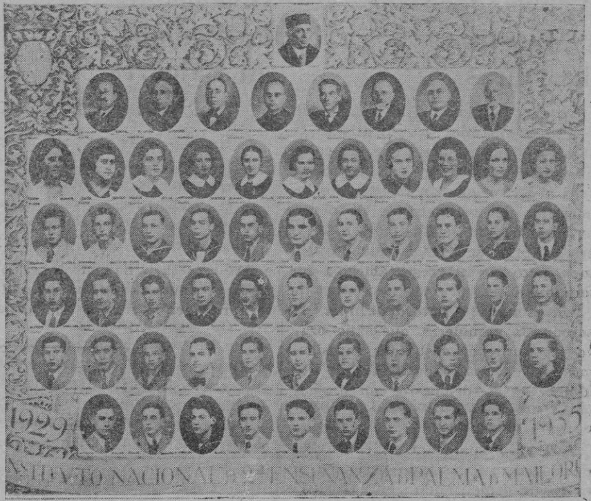
Los nuevos bachilleres del 1935. — cuadro de ritual con el Director y Catedráticos de nuestro Instituto

NOTA. —Para tomar parte en las carreras anunciadas en este programa.