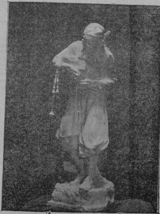
Tipic xaramier mallorquí. — Escultura por T. Vila.