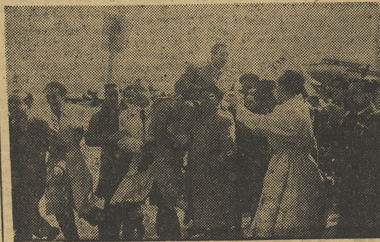
«Manolete», en hombros de sus admiradores, en el aeródromo de Barajas, a su regreso de América, en marzo pasado.