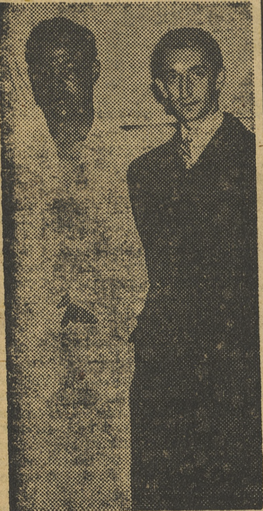
«Manolete» con Joe Louis, el campeón del mundo de boxeo, en Méjico, la última temporada.

sentido telegrama de condolencia a doña Angustias Sánchez, madre del infortunado diestro, con motivo del fallecimiento de su hijo.