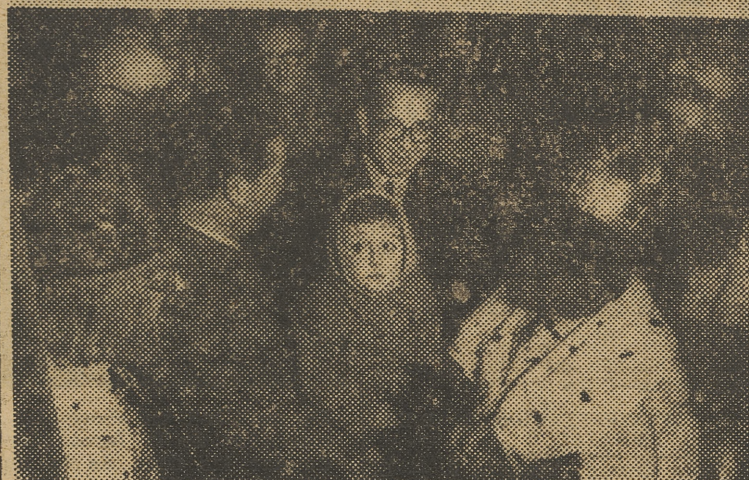
Una de las carrozas que formaban parte de la grandiosa cabalgata que organizó el F. de J., para recibir a los Reyes Magos. — Los Magos de Oriente, saludan a uno de los niños que acudieron a vitorearles, en presencia de las autoridades de Valencia.

Organizada por el Frente de Juventudes y patrocinada por el jefe provincial del Movimiento y gobernador civil se celebró ayer tarde la gran cabalgata de los Reyes Magos.