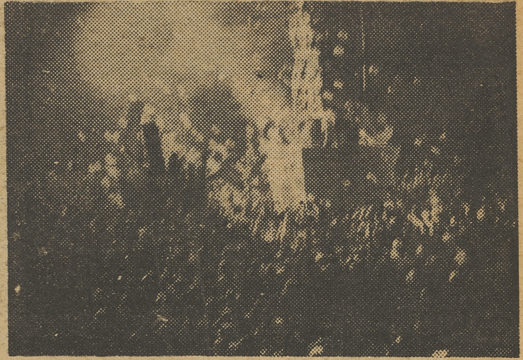
La multitud en Piccadilly Circus, el corazón de Londres, alrededor de la famosa estatua de Eros, en el momento de dar las doce de la noche en Big-Ben. — El fin de año en el célebre baile de los artistas, en Chelsea, donde más de cinco mil personas, con brillantes disfraces, revivieron las costumbres de antes de la guerra. Semanas antes no quedaban localidades para este baile, famoso en toda Inglaterra. — (Foto: Ortiz).